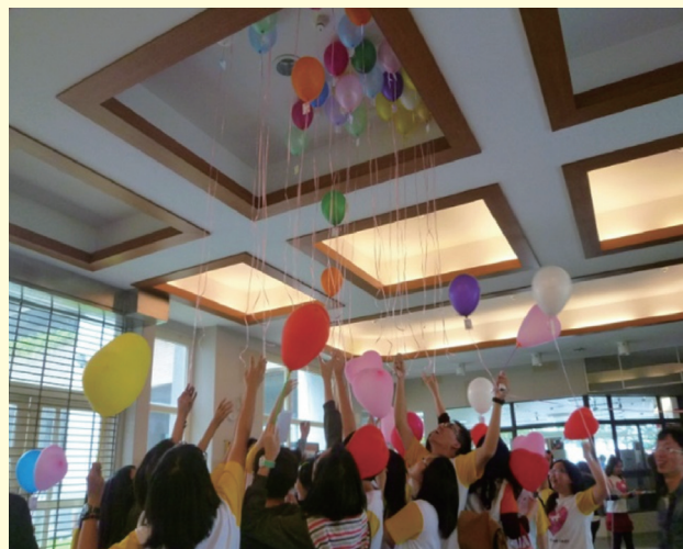
主題：愛，現在正好 【氣球任務，完成氣球裡面的感恩任務】

防治守門人養成攻略」、「做朋友的心情守門員—自殺防治守門人培訓」、「在藍色低谷點亮希望—陪伴他/她走過憂鬱」，讓每位同學都能夠學會如何面對自我低潮的狀態，學會珍愛自己、關懷他人。