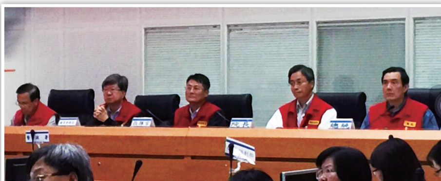
馬英九總統與行政院長、教育部長於中央災害應變中心聽取0206高雄地震災損情形報告

要擬訂個案輔導計畫，以長期追蹤協助。另依據維護突遭重大災害變故學生學習權益處理要點，請學校對受創學生學習採彈性處理。(校園安全防護科 邱光慶)