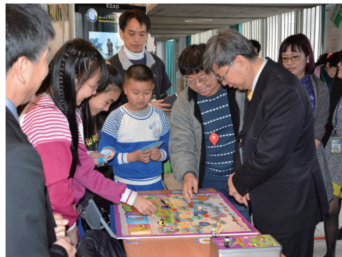
教育部吳思華部長參觀防災活動設計

師生了解所居住社區的地貌，並結合環境踏勘繪製社區與學校防災地圖，提升居民及師生防災意識及知能；苗栗縣啟明國小建置防災遊學中心分享教學資源，提供全縣學生套裝遊學體驗課程，分享在地化防災教學課程資源；臺中市土牛國小為使學生更熟稔防災