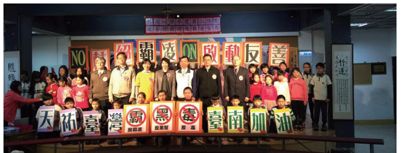
新竹市友善校園暨震災祈福活動

新竹市學生校外會吳晃廷督導也對此次竹蓮國小友善校園週結合臺南賑災關懷祈福提出嘉許，指出竹蓮國小師生用心讓友善校園週活動由「尊重他人」延伸至「尊重自然，愛惜生命，感恩惜福」，別具教育意義。(邱孔鐸)