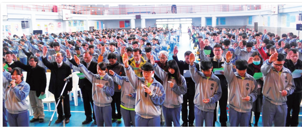
宜蘭縣礁溪國中全體師生共同宣誓

肯亞青少年女孩。(國立羅東高商 林再長) 附註：友善校園週系列報導詳載於本刊6版。