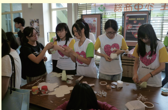
製作自己愛的天燈，隨著天燈啟動對自己的祝福吧！

除辦理活潑多樣的活動外，亦辦理自殺防治守門人培訓講座：「Hold住你的朋友—自殺