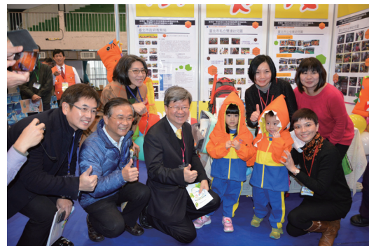
教育部吳思華部長與北市教育局同仁合影

教育部將持續強化並擴展防災校園建置，擴大精進作為，包括在地化災害潛勢檢核與校園踏勘、製作校園防災地圖、編修校園災害防救計畫、辦理防災避難演練、在地化防災教學、建置防災校園推廣基地，建置學校防災