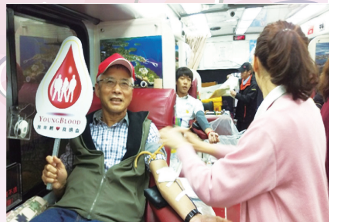
淡水商工校長率先挽袖捐血

新北市立淡水商工為深化推動紫錐花運動，於寒假期間舉辦反毒愛心捐血活動，由張校長率先捲起衣袖捐出熱血，張校長表示深化推動紫錐花運動是政府持續要求的反毒運動，重點在讓學生知道毒品危害的可怕之處，在瞭解毒品的壞處後，積極從事正向有意義的活動。近日因天氣寒冷捐血人口因而減少許多，血荒情形相當嚴重，同時也鼓勵學生大方捐出熱血，也可為社會盡一份心力。(曾文智)