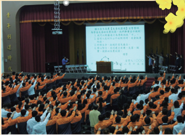
佳冬高農全校師生反霸凌宣誓活動

國立佳冬高農於開學當天由楊校長向師生宣讀友善校園意涵，並帶領全體師生進行反霸凌宣誓，另於致詞中期勉學生遠離毒品、勇敢向毒品說不，進而創造屬於自己的人生價值。校長並鼓勵學生要有道德勇氣，當發生校園霸凌事件時要能挺身而出。同時期勉同學要培養多元休閒活動，減少對毒品的好奇，並養成「肯做、能做、習慣做」的良好習慣。另外現今資訊發達應具備「尊重他人，健康上網」之正向觀念，每位同學都要防杜網路霸凌的亂象。(潘榮興)