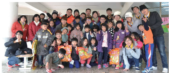
海洋大學社會服務團大合照

優先，希望透過本次營隊活動，輔以教育優先區計畫的實施，能平衡城鄉教育差距，實現「教育機會均等」與「社會正義原則」的精神。（學生事務科 張智凱）