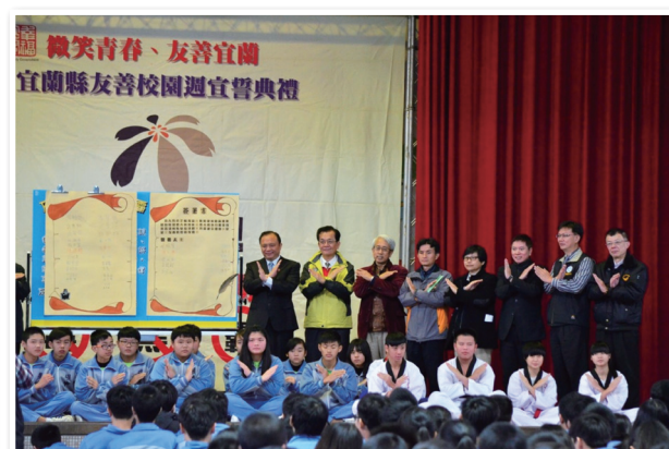
宜蘭縣林聰賢縣長及教育部黃子騰署長與同學合影