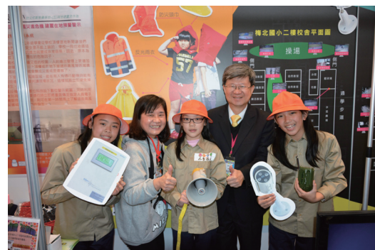
教育部吳思華部長和與會學生合影

為協助國內私立大專校院，落實學生事務與輔導工作，除了繼續依據「教育部獎補助私立大專校院學生事務與輔導工作經費及學校配合款實施要點」之規定執行外，並以建構核心價值與特色校園文化、營造友善校園並促進學生自我實現、培養具良好品德的社會公民、提昇學務與輔導工作品質與績效等作為學生事務與