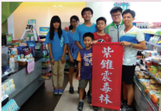
永仁高中參加學生開心與商家合照

臺南市立永仁高中推廣紫錐花反毒理念並響應教育部「全民拒毒」政策，讓學生了解毒品對自身的危害，於2月1日舉辦「紫錐震毒林、動手捐發票活動」，透過實質有意義的捐發票活動與愛心商家做零距離的互動宣導。校長指出，本次活動校方準備多樣精美禮品，邀請全校師生同仁一齊攜手捐發票散播愛心，使每個學生都成為反毒天使，當日總計約200人參加。(黃錫德)