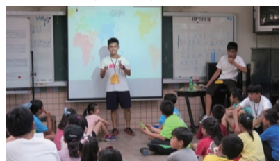
以世界地圖介紹各國風情

民國防」的理念，瞭解國際情勢，而不是侷限在狹小的島國文化，強化國家意識，培養獨立思考的能力，進而反思我國各方現況，尋求未來出路，將國防意識向下扎根，也讓同學意識到地球只有一個，而我們生活在這裏，必須具有的態度與責任。