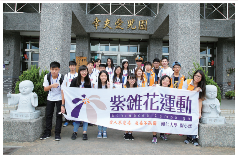
輔仁大學與中和高中學生至幸夫愛兒園宣導反毒理念

紫錐花社社員陪同園生玩「反毒大富翁」遊戲，讓年幼兒生植下紫錐花反毒的心芽；最後教導園生手做星砂，活動中由大朋友與小朋友談心聊天，讓園生瞭解人生不是孤單的，會有一群哥哥姊姊們引領他們走過青澀歲月，邁向光明人生。(輔仁大學 黃怡蓁)