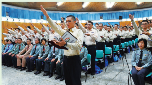
役男役男代表率領所有受訓人員宣誓代表率領所有受訓人員宣誓