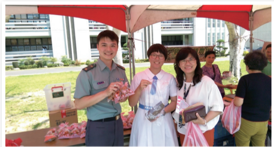
聖功女中師生以行動支持在地農產品

點，再讓學生了解國防並不只是軍事武力戰備的整備，而是各種國家軟實力的結合，人民意志的團結、國家經濟實力等因素，都是國防的一部分，讓愛臺灣、支持臺灣產業、農業不只是口號，而是發至內心的支持，進而達到全民國防的目標。(聖功女中 張中睿)