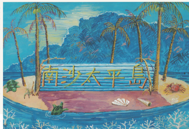
太平島任務紀念明信片

種磨練及試煉，很榮幸與優秀的伙伴完成這項艱鉅的任務，而機場跑道的建設，對我國南海執行運補、增援與人道救援等任務之能力有極大提升，對國家南海政策有興趣的青年學子，可報名參加國防部每年定期舉辦的「全民國防南沙研習營」，搭乘海軍軍艦前往中華民國疆域最南端的「太平島」，親身感受國軍戍守海疆，體現國軍保家衛國的辛勞，也進一步了解「太平島」對國家南海政策的重要性，增進南海戰略宏觀認知。