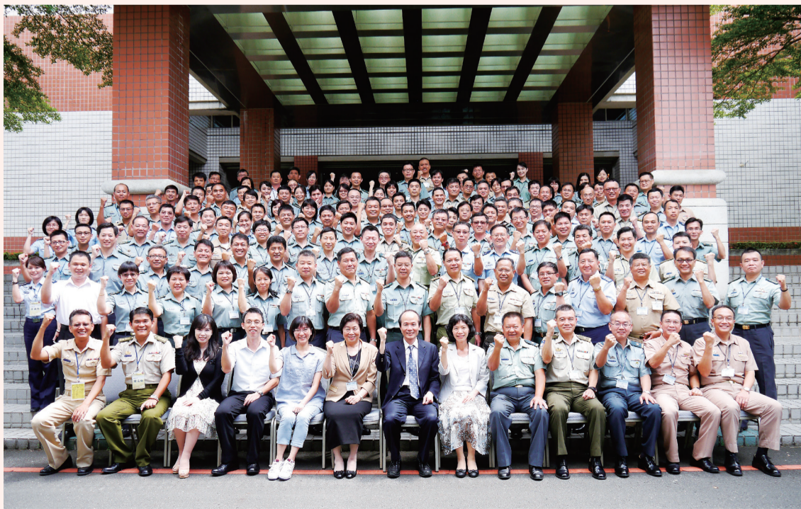
劉司長與大專軍訓主管合影高呼軍訓教官戰力強