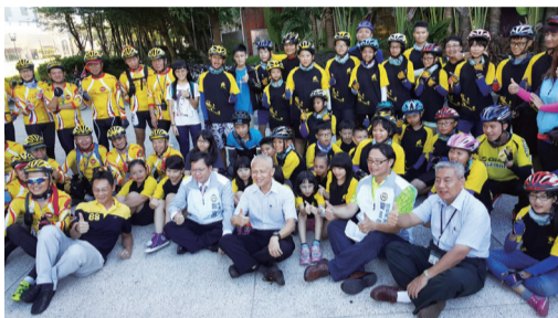
鄭市長及劉專委與參加挑戰學生合影

在鄭文燦市長授旗及各級長官的鳴笛加油下，孩子們個個信心滿滿，相信一定能克服挫折，努力朝夢想邁進，整體活動透過校外會教官及志工的全程陪伴與鼓舞，讓孩子們從中學會感恩、發現愛。（桃園市聯絡處 許健華）