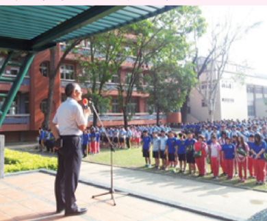
校園防災意識宣導

當基本觀念已經具備，身為校園安全守護者的兄弟姐妹們可以著手於以下建構安全的基本配備及作法：