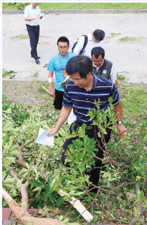
潘部長至臺東高中了解災情

因應尼伯特颱風造成臺東地區前所未有之嚴重災情，潘部長特別提醒各校依「教育部主管各級學校及所屬機構災害防救要點」，結合地區「災害應變中心」之資源，先期做好減災與防災整備等相關工作外，並依據各學校地理環境與特性，妥善規劃模擬應變與災後處置作為，實施「颱風災害防範演練」，藉以提升學校防災避難能力，熟悉緊急應變程序，有效減低校園災害，維護校園安全。（臺東縣聯絡處高佩怡教官）