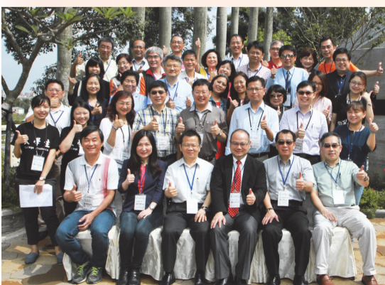
鄭司長與四區學務中心工作小組委員合影

別於北、中、南委託設置四區（北一區、北二區、中區及南區）大專校院學生事務工作協調聯絡中心。105 年度學生事務工作協調聯絡中心承辦學校為：國立臺灣師範大學、龍華科技大學、國立中興大學、國立成功大學。四區大專校院學生事務工作協調聯絡中心每半年召開一次跨區學務中心委員聯席會議，希望透過四區學務中心委員互動，形成支援系統，以達自我成長及統整資源之目的。（學生事務科 楊奕愷）