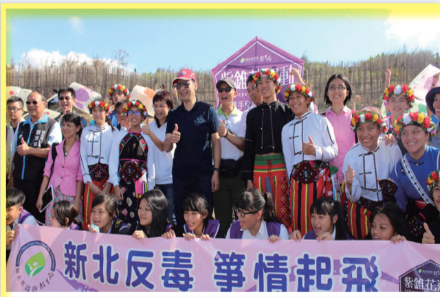
朱市長及劉專門委員於活動現場合影