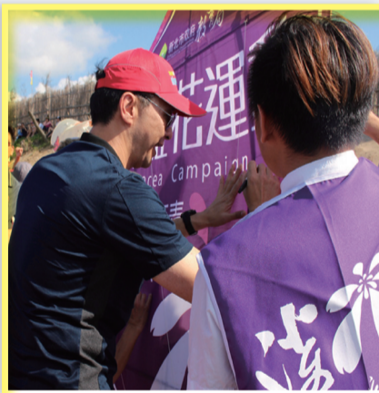
朱市長及與會嘉賓於紫錐花主題風箏簽名

此外新北市教育局也請黃景楨大師及鶯歌高職學生將反毒意象設計融入紫錐花運動文創小風箏，透過與民眾有獎徵答互動限時限量贈送，提醒民眾拒絕包裝精美誘人之新興毒品，讓陽光正面的反毒意念在每個人的心中發芽，將紫錐花運動精神推向國際。（新北市教育局游駿弘）