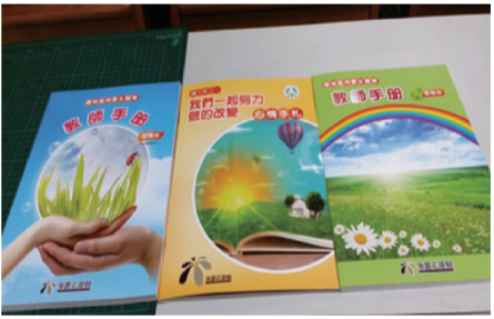
教育部藥物濫用學生輔導教師手冊

筆者很高興能落實運用教育部「藥物濫用學生輔導教師手冊」，它能考量到全面性的輔導，在系統化及多元化協助類案學生方面更似如虎添翼。謝謝教育部的前瞻性思維，也謝謝郭鐘隆教授團隊製作的專業化教材，讓教育現場的我們能按圖索驥地依循教師手冊之輔導課程，循序漸進地正向改變春暉個案之藥物濫用行為，有效協助學子脫離藥物濫用的危害。