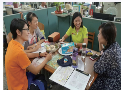
觀課後討論、心得交流

程中還能保持對學習的熱誠，這是最難能可貴的。 在少子化的今日，每個學生都是我們的未來、都是國家的支柱。如果傳統教育模式能持續改變，引領學生前進，有一天，會讀書的孩子不再是刻板的背書，而是能夠不斷翻轉創新的小夥伴；有一天，孩子們不再是被動被逼上學，而是主動到學校發掘新的知識與學問。此時，我們的國家一定會更強大，能夠重新被世界所關注，筆者衷心希望「翻轉教育、創新教學」的學、思、達教育，能持續在臺灣生根、茁壯。