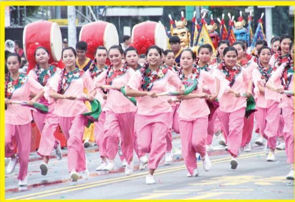
國慶大會學生表演