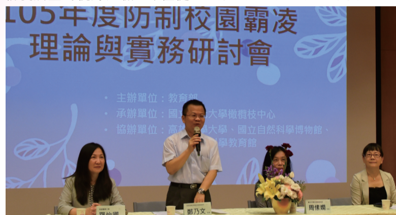
鄭司長於研討會中致詞

本年度三場次研討會共邀集高中、國中小第一線教育工作者以及法學、心理學、犯罪學、教育學各領域學者共23人擔任講師，以修復式正義理念為營造校園正向氛圍的核心，並以面對學生衝突或霸凌事件後的處理技巧為枝葉向外擴散，另輔以現階段霸凌類型研究之分析等三大部分進行研討分享及討論，使校園霸凌防制實務工作與學術理論達到經驗傳承與交流。最終，藉由各場次講座的問答座談讓與會之各校教師共同對話，進而提出實務上之建議，做為規劃未來防制校園霸凌的階段目標與政策參考。(校園安全防護科 許永傑)