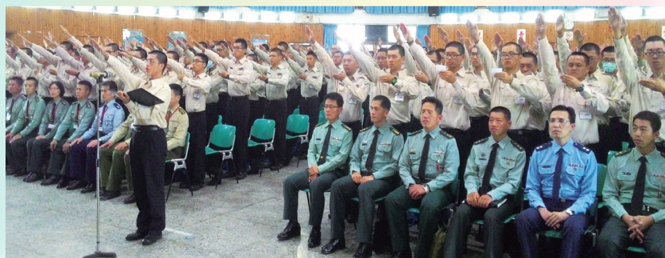
全體役男於開訓典禮中宣誓