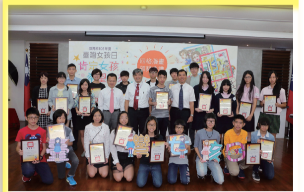
蔡政務次長與得獎同學合影