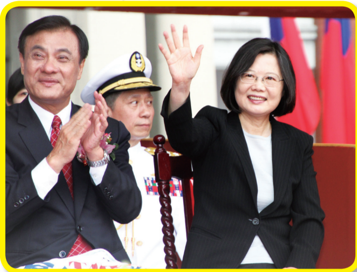
蔡英文總統與蘇嘉全院長親臨國慶大會

中華民國中樞暨各界慶祝 105 年國慶大會於 10 月 10 日上午假總統府前廣場隆重舉行，由國慶籌備委員會主任委員蘇院長嘉全先生擔任大會主席。本次國慶大會主題為「臺灣有你真好」，大會圖騰係以【繽紛國慶、多元臺灣】為理念，以繽紛華麗的顏色象徵多元族群的人民；不同顏色緊密交疊，象徵臺灣人的和諧包容與價值，彼此尊重、互助合作，構成一幅完美美麗的雙十。