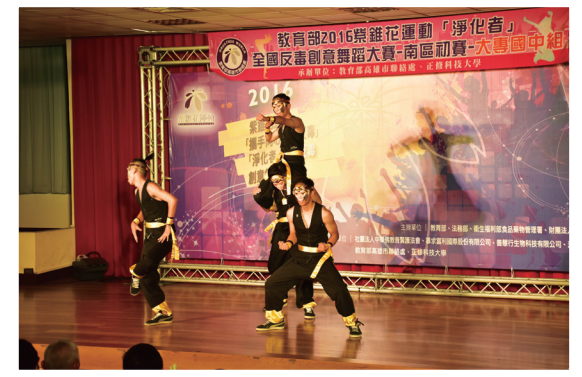
參賽學生於舞台上賣力演出

南區比賽場地在正修科技大學，一早就湧進來自南區大專院校、高中職及國中共 69 組參賽隊伍，大家都展現非勝不可的企圖心；教育部學生事務及特殊教育司劉家楨專門委員也蒞臨會場給同學打氣，他表示熱情與活力就是年輕人的本錢，參賽同學用積極正向的態度傳達反毒的決心，也以創意的思維直達紫錐花運動的價值，就是此次活動最棒的代言人。比賽在高雄市聯絡處戴一督導致詞中揭開序幕，戴督導特別勉勵所有的參賽同學，展現自己的青春，展現拒毒的決心，人生總