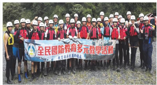
屏東縣聯絡處溯溪體驗活動合影

溯溪一開始先經過緩慢水淺的區域，逆流而上的每個關卡就更具挑戰性與刺激感，最後到了上游的水深急流區域，深刻體會到生死一瞬間及生命的可貴。回程順著水流而下，雖比逆