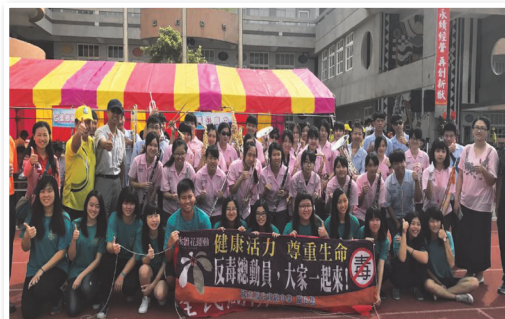
馬公高中師生宣導反毒紫錐花運動

長帶領該校管樂隊及學生至中正國小參加此項有意義活動，藉此鼓勵青年學子瞭解國防事務，培養學生對參與全民國防事務的興趣，強化澎湖學子之全民國防觀念，達到落實全民國防教育之目的；同時，為提倡正常休閒