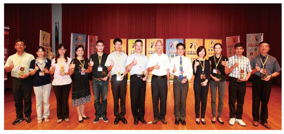
劉專門委員與大專校院資深生輔組長合影