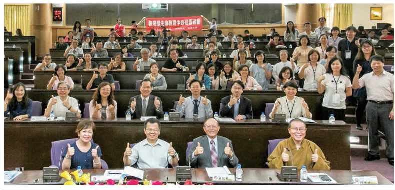
鄭司長與全體與會人員合影

現代毒品的樣貌不斷翻新，反毒工作已是刻不容緩，然而教條式的宣導所收成效有限，更重要的是如何傳達給青年學子正確觀念，引領他們找出自己對生命的熱情、對未來的期待，全國反毒創意舞蹈大賽便是深基於這樣的理念，期許人人都能成為社會風氣的「淨化者」，此次入圍全國決賽名單將於 12 月 15 日公告於活動報名網站及 Facebook「攜手同心 e 起反毒」官方粉絲網頁，讓我們一同為這群年輕的舞者喝采，也期許更多年輕學子加入我們的行列，因為一個對自己有所期待，對生命有熱情的人，不管毒品如何唾手可得，都會堅持反毒到底。(正義高中 黃雯蘭)