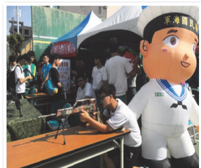
高雄高工學生參與國防教育攤位活動

此次校慶園遊會教官室負責各項活動宣導，在教官團隊積極規劃下，讓學生透過趣味的活動設計以增進反毒及交通安全等各項知識以及各式從軍管道。〈高雄高工 李佩珊〉