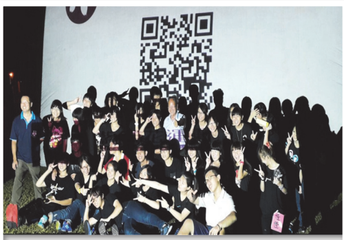
輔英科大香海社及春暉社學生誓言終身反毒

欣賞會後主持人針對紫錐花運動的緣由進行宣導，並以有獎徵答活動方式讓現場氣氛達到最高潮，傳達勇敢拒絕毒品的觀念，透過反毒宣導活動的用心和愛心，以建立無毒的家園。〈輔英科大 姚秋蓮〉