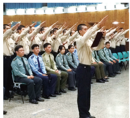
全體役男於開訓典禮中宣誓