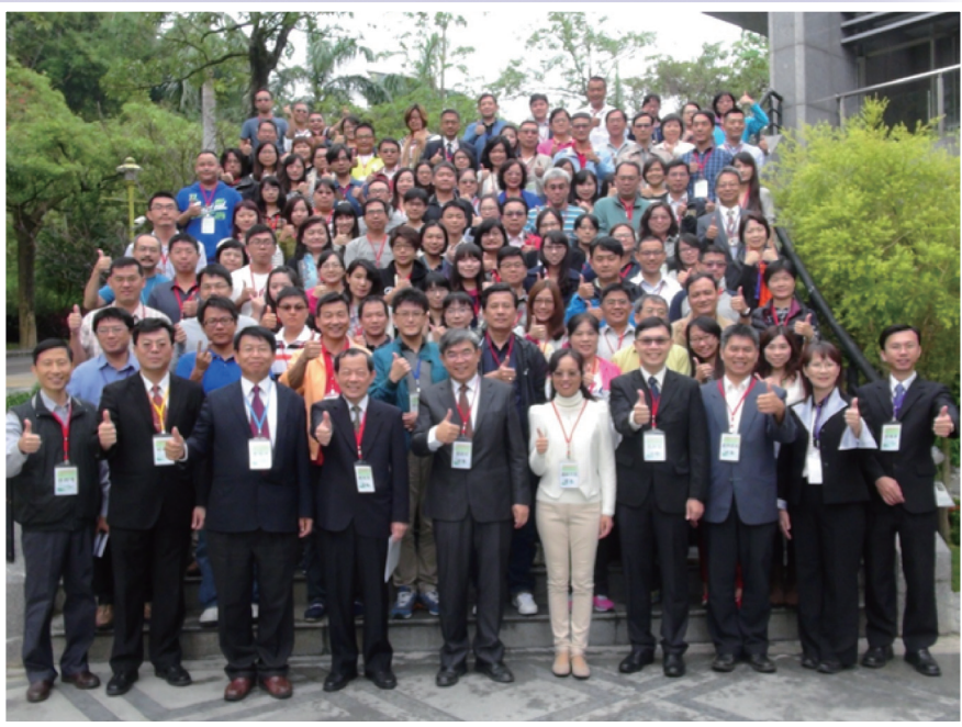
蔡政務次長與105學年度「品德教育推廣與深耕學校」代表合影