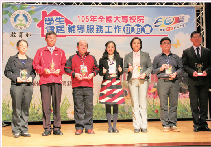
顏副司長與105年賃居輔導服務工作績優學校代表合影

教育部於105年11月24、25日辦理105年度「全國大專校院學生賃居輔導服務工作研討會」，會議一開始頒獎表揚105年度「績優賃居服務工作」單位及個人，計有6間學校及8位個人榮獲此殊榮，之後由教育部學生事務及特殊教育司顏副司長寶月主持。顏副司長致詞並期勉各校未來能繼續在學生賃居工作上，不斷創新服務，以強化學生賃居之安全。