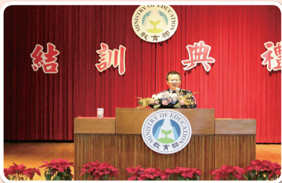
鄭司長於結訓典禮時致詞

最後，司長期許在座的每一位學員，離開之後都能自信自己能成為一位合格的學務校安人員，日後為校園及莘莘學子提供優質服務，為每位孩子找到屬於自己的天空，為建構友善校園共同努力，提供校園師生更好的協助與服務。