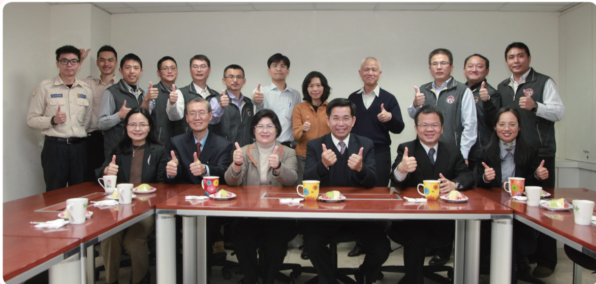
▲教育部長及各級長官提前至校安中心向同仁祝賀春節，過程溫馨融洽。

潘部長對於整體校園災害管理機制之功能與績效表示高度肯定，並期勉校安中心全體值勤人員務必堅守崗位，確實掌握春節期間各級學校校園安全狀況，保持縱向通報、橫向聯繫機制，即時協助各級學校妥處各項突發校安事件，確保春節期間校園安全。（校園安全科 王國偉）