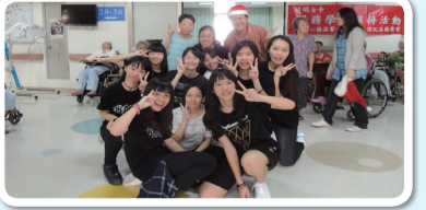
服務學習活動合影

從服務中看見長者靦腆的笑容，更體會「為別人做事，生命更有意義」。以往教官從事教學與輔導工作常被外人認為不夠積極，自從筆者加入志行列後，更能深切體認，從事教官服務工作多年，施比受更有福。主動關懷家中突遭變故的學生，並積極協助申請急難救助之後，從學生及家長的神情中看見了無限的感激與謝意，筆者自己的心中也充滿感動！帶領學生社區打掃，我們的表現紛紛獲得住戶豎大姆指讚賞與肯定，還主動拿飲料慰勞服務學生；關懷弱勢族群中，看見她們在靦腆下的無限感恩與心喜，藉由團康活動散播歡樂、散播愛，讓真情滿人間。藉由志工服務，我更愛這份工作，相信全國的教官都因熱愛這份工作而願更努力付出，讓我們一起為他人生命更發光發熱！