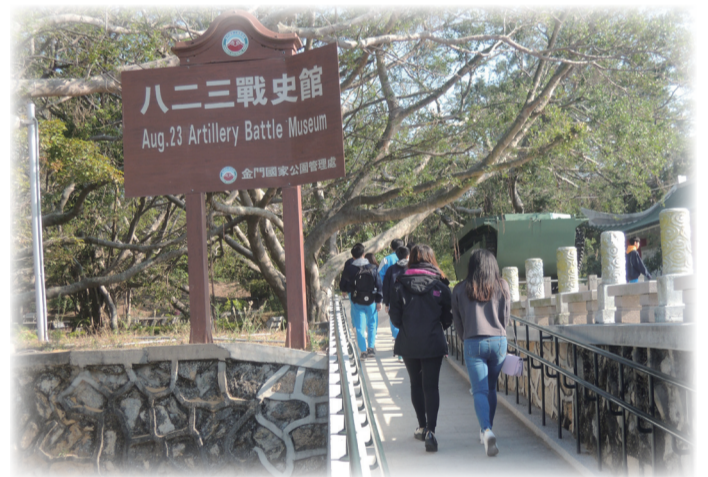
金門高中學生健走至八二三戰史館

學生在邊走邊參觀之際，在指導老師強力宣導下，使學生體會到原來簡單一句口號，擁有著深刻的涵意，一個小小的健走活動，換來大大的反毒知識，是這次的行動最大的收穫。在社員們積極努力下，雖然行程很累，卻也帶給學生一個難得的經驗；防制藥物濫用工作是目前各級學校的重點工作，尤其高中職學生的藥物濫用人數日益增多，希冀能藉由此次活動，讓學生每天都生活在充滿著無毒環境的意識與情境中，透過學生們彼此互相影響，建立同學拒毒觀念，打造美麗友善校園，有效減少學生吸毒率。（金門高中 黃志豪）