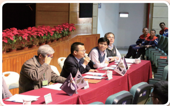
司長於結訓座談與學員交換意見