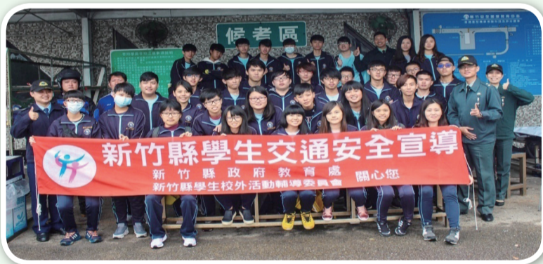
關西高中師生於新竹安駕訓練中心合影

而在學生最期待的術科課程中，特別邀請安駕中心專業講師，針對同學日後平時生活最常使用的交通工具「機車」，做正確的安全駕駛方法說明，並考量現今機車筆試及路考考照無法替代完整騎乘安全教育功能，特別著重於機車安全駕駛、如何正確使用煞車、轉彎的技巧及用路觀念宣教等，期藉生活化與實務課程之設計，強化精進交通安全宣教內涵，並讓同學們親身體驗正確、安全駕駛機車的技巧。看著學生們熱絡的反應，相信對於交通安全觀念有更深刻的體認，希望藉此活動使同學們能更正確且安全的騎乘機車，以降低交通事故發生機率。（關西高中 韋仕豪）