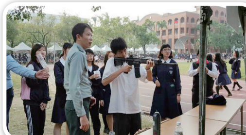
長榮女中日本姊妹校學生體驗射擊遊戲

此外，紫錐花社團以射擊遊戲的方式與日本學生進行互動，期待藉此機會宣達紫錐花運動的理念，讓日本學生了解我國推動紫錐花運動的反毒精神，並且贈送紫錐花圖騰獎品，讓日本學生感受我國反毒決心，讓「紫錐花運動」反毒總動員，由校園推向社會、由國內推向國際，全球一起來，更期許在國民外交的交流中創造更豐富精彩的歷程。（長榮女中 曾俊傑）