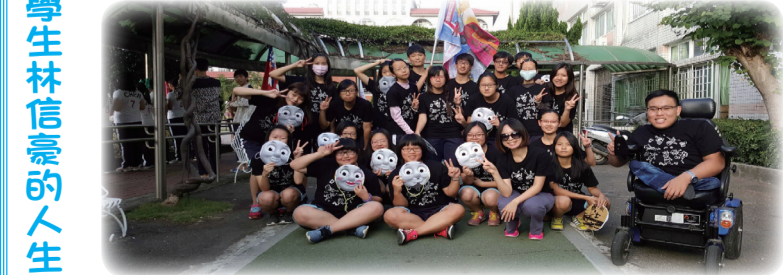
信豪感謝同儕協助讓自己跨越校園生活及學習各項阻礙

我國兩公約第二次國家報告國際審查會議，業於1月16日至18日假財團法人張榮發基金會國際會議中心舉辦完竣，由總統府人權諮詢委員會邀請長期參與聯合國人權保障工作之國際人權專家擔任國際審查委員，來臺審查我國兩公約第二次國家報告，並就我國重要人權議題，與我國政府機關代表及來自國內外的人權團體透過對話的方式進行廣泛且深入的討論。