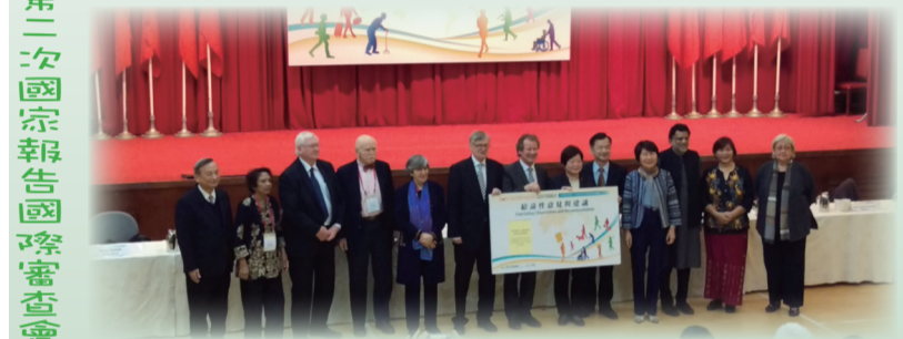
兩公約第二次國家報告國際審查會議結論性意見與建議發表記者會

我國以制定施行法方式完成「公民與政治權利國際公約」、「經濟社會文化權利國際公約」、「消除對婦女一切形式歧視公約」、「兒童權利公約」及「身心障礙者權利公約」等5項國際人權公約之國內法化。教育部業於105年12月26日發布「教育部人權及公民教育中程計畫(106-110年)」，將配合前開5項國內法化公約，廣續強化各級學校親師生與行政人員認識人權及公民教育與相關人權公約，並配合十二年國民基本教育之推動，發展課程及教材，營造落實人權保障、重視公民責任、相互尊重與包容之友善教育環境。