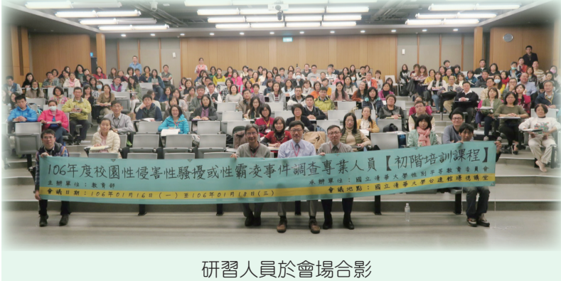
研習人員於會場合影

依據「性別平等教育法」第30條規定，教育部每年均辦理「校園性侵害性騷擾或性霸凌事件調查專業人員培訓」，通過40小時以上完整培訓的教育人員，將列入本部「校園性侵害性騷擾或性霸凌事件調查專業人才庫」。自92年啟動調查人才庫機制迄今，已有1,800餘位專業人員名單公告於「教育部性別平等教育全球資訊網」，提供各級學校或主管機關延聘進行調查工作，為保護校園性別事件中的當事人盡一份心力，營造性別平等的教育環境。 本年度教育部委請國立清華大學於1月16日至18日假該校台達館辦理，依據「校園性侵害性騷擾或性霸凌調查專業人員培訓及調查專業人才庫建置要點」規定，初階培訓課程包含「基本概念及相關法規」、「危機處理與媒體公開」、「處理程序及行政協調」、「校園性侵害、性騷擾或性霸凌事件調查程序」、「調查程序中運用諮商技巧之訓練」及「懲處追蹤與行政救濟」合計23小時，全國共有200位大專校院教育人員報名參加，顯見各校對於校園性別事件防治之重視。 教育部雖長期投入校園性侵害、性騷擾或性霸凌事件防治及調查工作，惟校園中的實質性別平等，仍須仰賴全體師生及家長共同參與，學校並應落實「校園性侵害性騷擾或性霸凌防治準則」第2條規定，積極推動校園性侵害、性騷擾及性霸凌防治教育，以提升教職員工生尊重他人與自己性或身體自主之知能，進而建構友善校園環境，保障學生之學習權益，有效促進性別地位之實質平等。（性別平等教育及學生輔導科 黃乙軒提供）