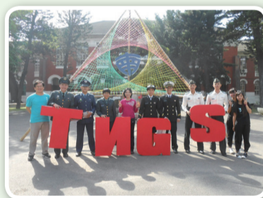
軍校校友回娘家宣達全民國防教育理念