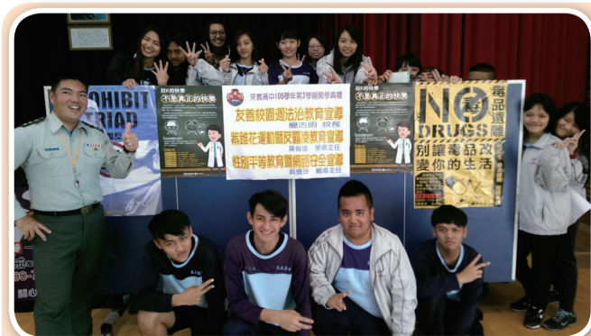
屏東縣義高中文學友善校園法治教育宣導

另為提升活動理念，各校亦對學生加強實施人權、法治、品德及生命教育，奠定友善校園的基礎；友善校園週活動理念主要是以學生為主體，結合師生共同參與推動；以學校為舞臺，整合校內外資源讓全校動起來，喚起國人及各級學校對建立友善校園的重視。教育部籲請各校營造以學生為本的健康、安全與友善校園，提供一個優質的教育環境，讓孩子可以快樂學習成長。（除本版外各聯絡處及各校友善校園週活動詳見第六版—友善校園專刊）。