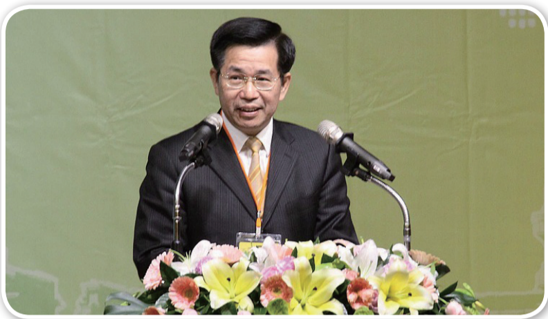
潘部長於全國大專校院校長會議以「面對挑戰 迎向未來」發表專題演講

106年度全國大專校院校長會議1月12日在高雄舉行，包含軍警院校在內，全國共有158所公私立大專校院校長出席，會中教育部潘文忠部長以「面對挑戰，迎向未來」發表專題演講，獲得熱烈回響。