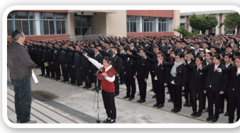
四維高中辦理『三好三反』誓師活動

另在舞感社為全校帶來青春洋溢的活力熱舞表演下，亦宣示毒品、黑幫及暴力是絕對禁止進入校園的，四維高中將持續強化推動反毒活動，期能在校園建構安全及友善和諧的學習環境。（四維高中 徐美嬋）