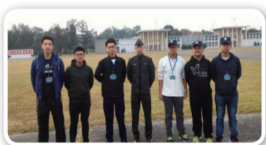
與陸軍官校學長合影