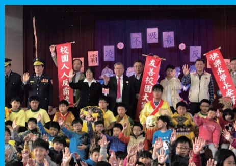
新竹縣縣長及與會貴賓合影

的簽署活動，同時也擊倒校園三害一「黑道」、「毒品」、「霸凌」的立牌，再由與會的長官來賓與學生們一起合力的將貼有「黑道」、「毒品」及「霸凌」這三害的大球奮力的逐出校園，象徵落實無幫派、不吸毒、零霸凌，營造安全、健康、又有活力的友善校園環境。（新竹縣聯絡處 黃國昌）