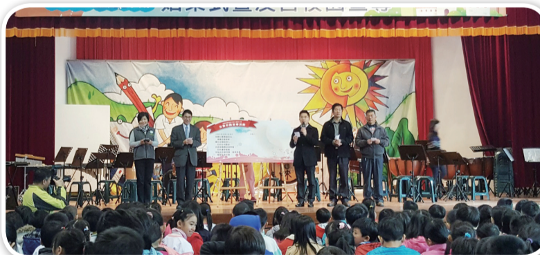
臺東縣縣長及貴賓參與新生國小友善校園週宣導

最後由黃縣長帶領全校師生進行反霸凌誓師活動，教育部長官與來賓亦共同宣誓「我願以最真誠的心，落實品德教育，關心並幫助別人，反對任何霸凌，拒絕接觸毒品與黑幫，反對遭受威脅，我堅持友愛同學、尊敬師長，營造友善校園」。（臺東縣聯絡處 黃建儒）