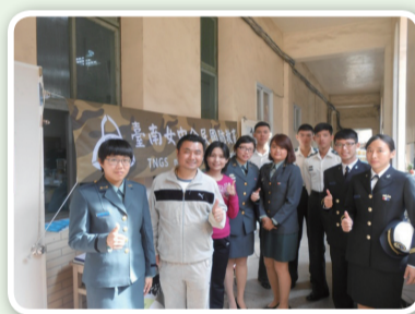
臺南女中舉辦全民國防教育活動

獎項的態度，這就是培養同學榮譽心的最佳寫照，正和我國軍的基本信念「國家、責任、榮譽」相互輝映，在本校99週年校慶的同時，邀請畢業生從軍校回娘家，共同超越99、迎向100，為本校全民國防教育多元活動留下最美的身影及特別的回憶。