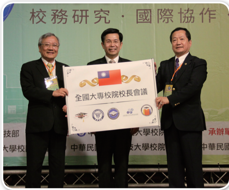
教育部長與大專校院校長合影

群，甚至有機會參與國際事務，獲得課堂及書本以外的學習。潘部長表示，人才培育最終仍是希望任何一所學校培養出來的孩子，能真正賦予他們更多新的能力、新的工作態度與新的專業素養，而在原本既定的環境與政策之下恐怕難以滿足對於適性揚才的期待。（節錄自教育部電子報）