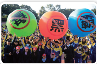
桃園高中友善校園活動-滾動反黑、反毒、反霸凌龍球活動