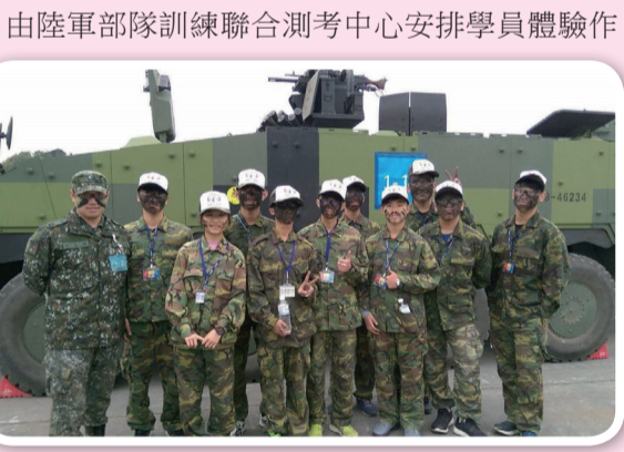
長榮高中戰場抗壓體驗營合影

為全面推廣全民國防，增進學生國防資訊，臺南市長榮高中於106年2月9日參與國防部舉辦之106年度「戰場抗壓體驗營」，此次活動係藉戰場心理抗壓模擬訓練館進行參訪及體驗，延伸全民國防教學內容，凝聚保家衛國意志，強化總體防衛理念，俾利建立國防共識，擴大全民國防教育效果。