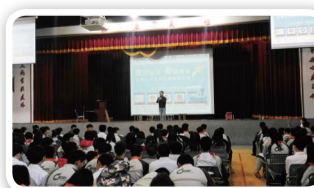
反毒生命教育巡迴列車進行友善校園宣導

暨大附中增加警監系統及陰暗角落燈光照明設置，做到校園零死角；安排校園安全實務講習，強化導師及教職員工校安知識；上下課及放學期間由全體教官不定時實施巡查，防杜學生及校外人士違規滋事；結合警政機關及家長會，密切掌握學生校外活動，杜絕黑幫進入校園。張校長期許並勉勵同學：友善校園不只是老師的責任，每一位同學對於霸凌事件，不管是自己還是別人，都應該伸出援手相助，今天你幫助別人，明天別人也會幫助你，今天你尊重別人，別人亦尊重自己，善待校園的每一個人、事、物，讓尊重、關懷與包容，深植日常生活之中，友善校園將不會再是一項口號。（暨大附中 黃建翰）