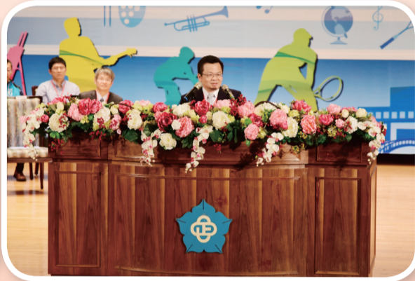
鄭司長於觀摩活動中致詞