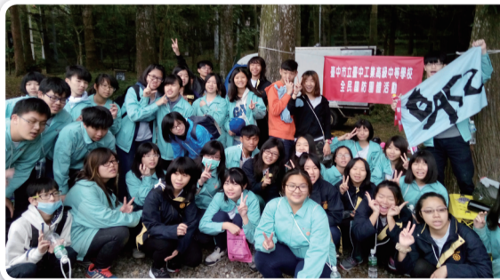
臺中高工公民教育暨全民國防活動合影

為增進全民國防教育，培養學生正確公民素質，國立臺中高工於106年3月假日月潭青年活動中心舉辦105學年度加強公民教育暨全民國防團體活動，由校長黃維賢主持，活動期程共計四梯次五天，活動內容包含環境保護教育、團體互助合作、認識原住民及大自然生態及全民國防漆彈射擊競賽等，活動內容豐富且多元化，參加學子均能在活動中學習到愛護環境及全民國防的正確觀念。