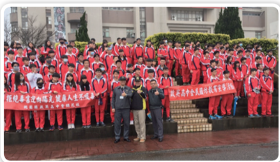
啟英高級中學師生於楊梅高山頂營區合影

國防部藉由多元活潑及寓教於樂方式，提升學生興趣，引導學生共同體驗國防事務，深化青年學子對國防安全的認知。（啟英高中 程文仁）