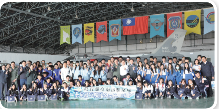
參訪師生與空軍443聯隊教官於經國號戰機前合影

參訪過程學生們踴躍的向說明官發問，深入瞭解空軍平時任務為負責臺海偵巡、維護臺海空域安全，堅實戰備整備及部隊訓練任務，充實戰力完成戰備，適切支援各項重大災害防救工作；戰時全力爭取制空，並協同陸、海軍遂行各類型聯合作戰，以有效發揮空軍作戰之效能。