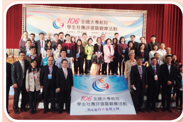
鄭司長及與會來賓合影

學生經由參與社團，透過組織訓練與活動，可以培養群育、擴展知識、發展興趣，並習得民主法治素養與磨練領導才能與服務社會的機會，也常看到學生社團利用課餘時間進行偏鄉服務，從社團活動中體會服務參與的樂趣，從中成長自己，養成樂觀進取、積極奉獻及關愛社會的人生觀。本次活動共有145所公私立大專校院278個學生社團參與評選，相互觀摩學習，增進學生社團的發展。