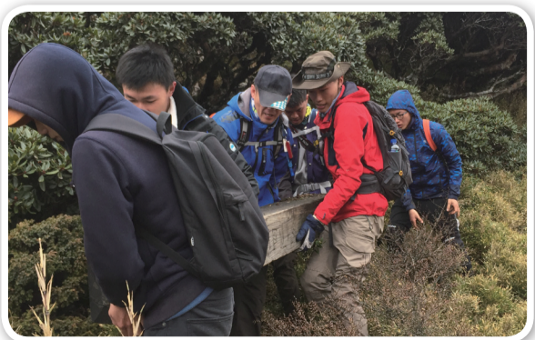
朝陽科技大學師生合力搬移合歡山東峰

南投縣消防局亦表示，合歡山東峰立標失蹤多日，如有不熟悉登山路況之旅客登山，可能迷失方向持續登高行走，較易造成山難。此次淨山活動深受外界的肯定，且朝陽科技大學師生合力重立合歡山東峰立標，亦是實踐品德教育的最高表現。（朝陽科大 周喜民）