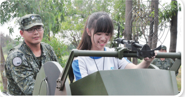
學生親身體驗空軍防砲武器操作