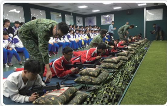
啟英高級中學學生體驗T91步槍模擬射擊

來精采的「操槍表演」。在模擬射擊體驗時，同學親身參與火砲射擊底火試拉及「T91步槍模擬射擊體驗」活動，使平時沒機會近距離接觸國軍裝備的同學，可藉此時機了解火砲射擊及T91步槍射擊程序與靶場實況。