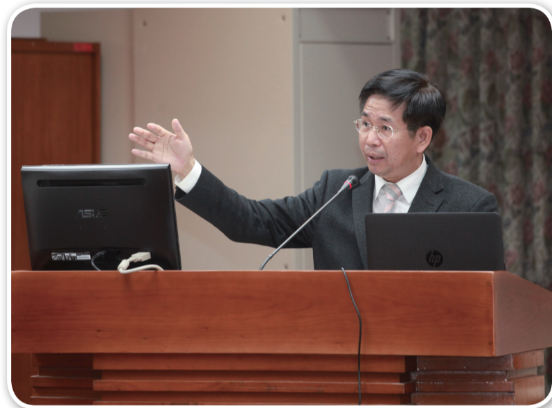
教育部長於立法院報告校園毒品防制成效情形