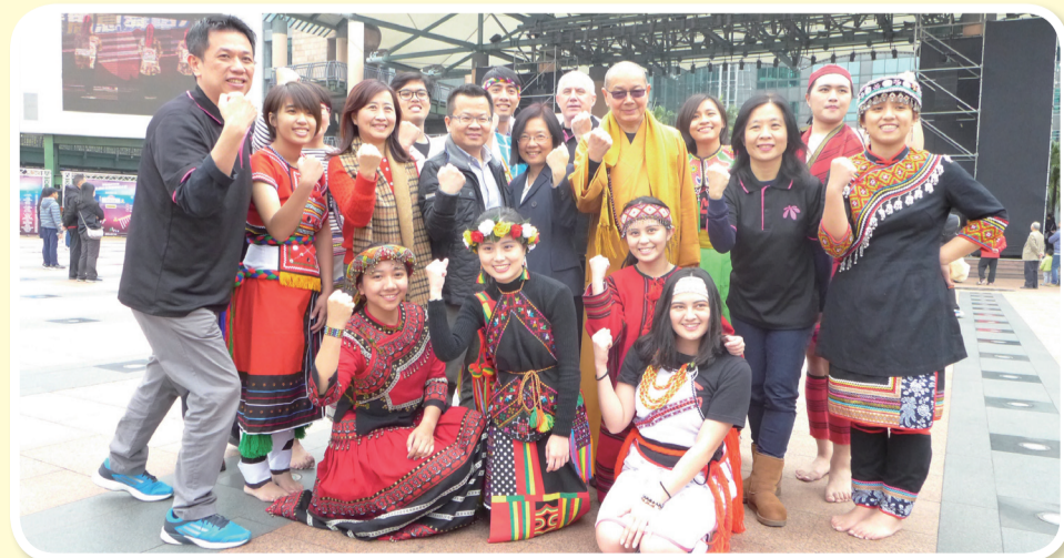
教育部鄭乃文司長及貴賓與輔仁大學原資中心表演學生合影

市民廣場再次齊聚，以舞會友，主辦單位教育部學務特教司司長鄭乃文、法務部保護司司長羅榮乾、衛生福利部食品藥物管理署組長蔡文瑛、新北市長朱立倫與財團法人淨化社會文教基金會釋淨耀法師及承辦單位輔仁大學副校長聶達安神父將聯袂出席，象徵跨部會攜手合作，共同主持開幕儀式。