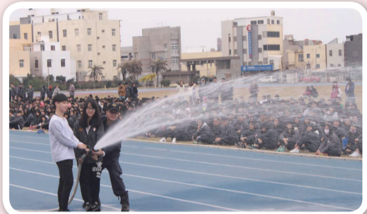
災害防救演練-消防水帶體驗

馬公高級中學學務主任方崇真表示，地震、火災、溺水、一氧化碳中毒事件時常發生，平常即需落實災害防救演練，讓學生建立正確消防觀念及危機意識並體驗逃生要領，如遇狀況發生時，方能立即完成逃生疏散並確保人身安全，將傷害減到最低。（馬公高中 陳智雄）