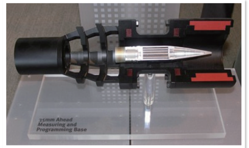
AHEAD彈藥通過初速測量器時之示意圖（103年台北國際航太暨國防工業展）