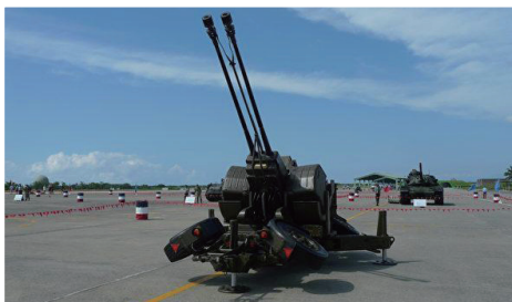
空軍三五快砲GDF-006型（101年新竹空軍基地營區開放）

整體而言，換裝可射擊AHEAD彈藥的性能提升，不單單只是進化，而是「有效的進化」，因為航空技術的突飛猛進，來自空中的威脅愈趨複雜，如巡弋飛彈、無人機等；航空器體積漸小甚至匿蹤，若是僅再依靠碰撞炸裂的傳統高爆彈藥，將無法有效的獵殺目標，而AHEAD彈藥的優點，提升「擊傷」目標的機率即可有效解決這個問題。但是從另一方面來看，航空器變得不容易被直接擊燬，也就是仍有極小可能會完成任務，因此在換裝AHEAD此等名劍般的武裝後，如何強化三軍聯合防空的效率，就變成了下一個要謹慎面對的問題。