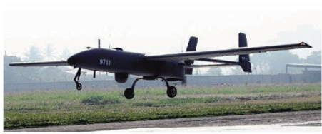
中華民國銳鷹無人機/中科院

無人機又稱無人飛行載具(Unmanned Aerial Vehicle，縮寫：UAV)，其發展已有90年的歷史，早期皆以軍事用途為主。近年來受到物聯網概念發酵，已發展到商業、農業、國防領域等進行高價值應用，並成為指日可待的殺手級產品。事實上，本「納動員於施政、寓戰備於經建」，以蓄養戰爭潛力，無人機具有顛覆國防產業未來的潛力，並在不對稱作戰提供更廣泛且低成本的戰術選擇。