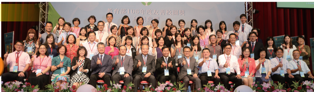
▲ 潘部長與友善校園獲獎人員合影

為表揚推動學生事務與輔導工作表現卓越的學校及人員，教育部於106年10月17日（星期二）下午於銘傳大學舉行「教育部106年度友善校園獎頒獎典禮」，並由教育部潘文忠部長親臨表揚6類53個獎項的獲表揚者8所卓越學校，45名傑出人員（含傑出學務人員12名、傑出輔導人員11名、傑出導師12名、傑出行政人員4名及特殊貢獻人員6名）。相關獎項事蹟特色如下：