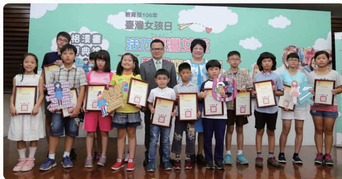
鄭司長與獲獎學生合影

妳跳起來」以及「舞出自信、舞出熱情」。透過本次表演，展現出臺灣女孩的繽紛活力與自信熱情。