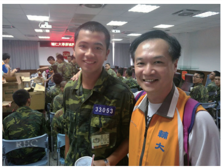
筆者與學校教官合影