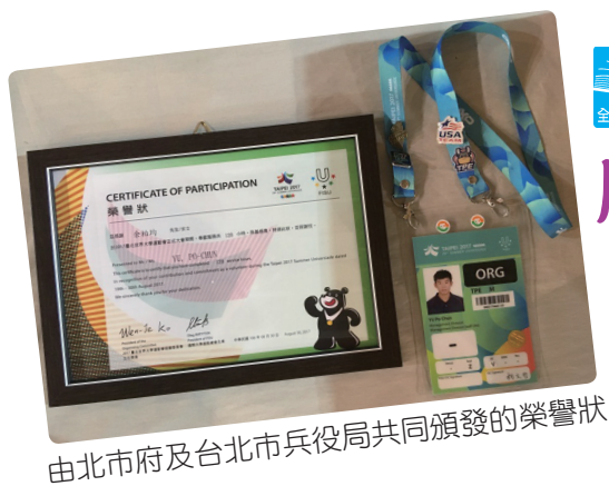
由北市府及台北市兵役局共同頒發的榮譽狀