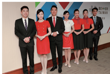
擔任國慶禮賓接待任務的銘傳親善服務隊

擔任多年國慶禮賓接待任務的銘傳親善服務隊，在每一位同學的努力下，高度展現銘傳親善服務隊在國慶典禮上的用心與貼心，銘傳將持續以專業的服務、親切的笑容、清新的形象，在國慶日當天服務參與國慶典禮的貴賓們，並共同祝福我們的國家「生日快樂」！