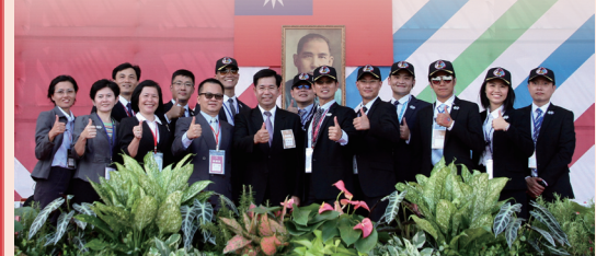
教育部長與慶籌會工作人員合影

近2個月的籌備期間，大會處每位夥伴均齊心協力，充分發揮團隊合作精神，從進駐到國慶大會活動舉辦，多次協調會議、驗收與預演編排，都能秉持著堅定不移的信念，努力克服並圓滿達成任務。(慶籌會 翁豪將供稿)