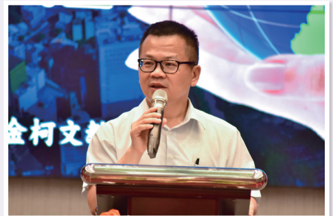
鄭司長於研討會中致詞

校園安全危機潛藏因子及天然災害是無法預測，具有突發性且無固定形態，且校外人士入侵校園造成學生傷害事件皆為社會大眾所矚目及關注焦點，教育單位已建立教育、警政三級聯繫平臺與預防機制，惟校園安全各項防護作為卻是必須持恆努力，希冀透過研討會了解校園危安態樣轉變暨落實風險管理，進而讓各校依據學校地區特性及人文環境實施安全檢測，