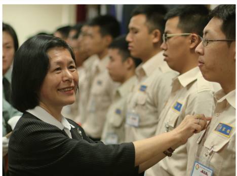
曹副司長於結訓典禮中賦予管理幹部職務

教育部教育服務役專業訓練班第182梯次暨管理幹部訓練班第163期結訓典禮，於106年10月13日假康寧大學臺南校區舉行，典禮由教育部學生事務及特殊教育司曹翠英副司長親臨主持，另有康寧大學鈕大旻主任秘書、大仁科技大學邱懋崑學務長、樹人醫護管理專科學校軍訓室鄧國陞主任、高雄市聯絡處戴一督導、台南市聯絡處穆堃豪助理督導及183梯次汪祖華執行官、許永傑副執行官等貴賓蒞臨觀禮。