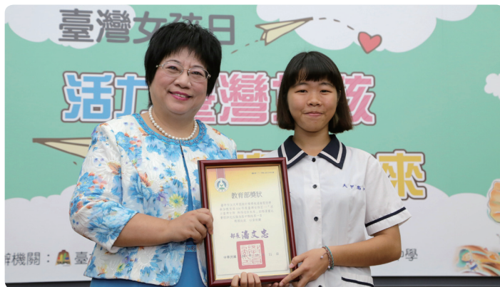
明倫高中曾校長頒發高中組第一名學生獎狀