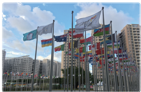
賽會最後一天，各國國旗依然飄揚在選手村廣場

最後，真的覺得很幸運能夠有這個機會來支援世大運，也深深地覺得自己的付出其實還很渺小，因為有更多人是在嘔心瀝血地燃燒自己的生命，只為了做好一件事情，希望有參與過這個盛會的人，都能記住曾經在心中種下的種子或是盪起的漣漪，繼續將對運動的感動延續下去。