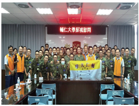
學校慰問團隊與參與學生合影

當別的同学都興奮地在倒數暑假開始的時間之際，我卻是繃著一張臉在倒數著入伍的日子，但是這趟旅程，卻豐富了我的人生。