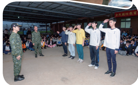
▲ 臺北市教育局軍訓室曹守全 上校頒贈獎狀給獲獎學生

在幾乎沒有間斷的射擊競賽後，緊接著展開下午國防體適能戰技競賽，首先帶領各校年輕的選手們做暖身操，伸展筋骨，迎接充滿挑戰的戰技對抗，選手們不論兩兩一組或是單槍匹馬，無不使出渾身解數的看家本領，展現自身的體能極限，在兩隊相互較勁，滾輪胎、傷患救護、彈藥補給、丟擲手榴彈接連不斷的激烈對抗，最後由每隊最後一棒全副武裝匍匐前進，並以跑百米速度提槍快跑，跑出團隊漂亮的成績；在進入八強對抗賽中，看見每位學生展現出必勝的決心，更能感受到參賽學生們的團隊榮譽感。