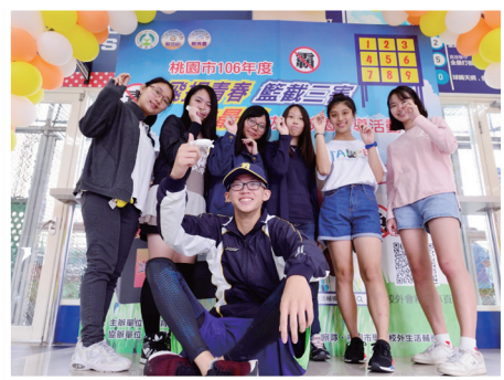
桃園市學生熱情參與活動

念。桃園市學生校外會劉副督導表示，秉持每一位孩子都是反毒大使，每一位孩子都可以改變未來的理念，未來將貫徹行政院「新世代反毒策略」，為孩子量身打造反毒活動，讓每位青年學子能在活動中獲得滿滿的正面能量，挑戰自我，更加健康自在。