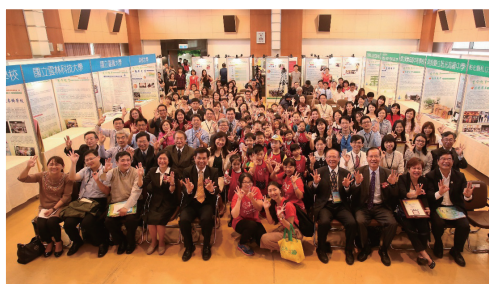
▲ 生命教育特色學校暨績優人員表揚大會現場氣氛活潑熱絡