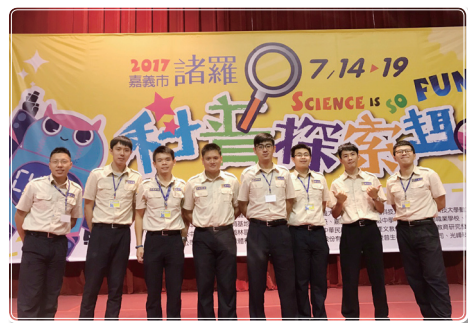
諸羅科普探索趣役男夥伴合影