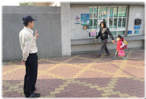
附屬幼兒園導護情形