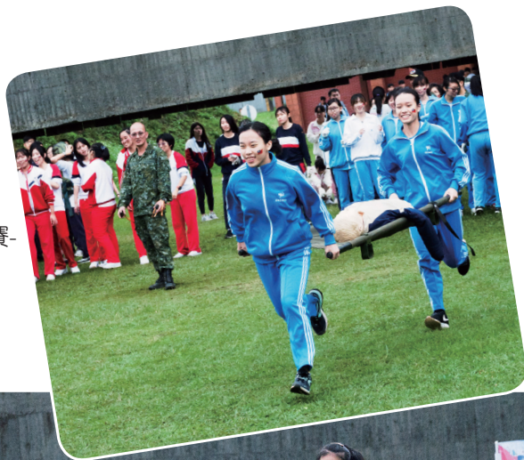
► 國防體適能戰技競賽- 傷患救護

競賽最後依積分賽制，選出175公尺實彈射擊競賽男子組第一名政大附中及萬芳高中、女子組第一名內湖高中，國防體能戰技競賽男子組第一名十信高中、女子組第一名永春高中，綜合實彈射擊及國防體能戰技成績後，評選出全能勇士獎男子組第一名萬芳高中、女子組第一名永春高中，各頒發團體圖書禮券以茲鼓勵，期為推行全民國防教育達成良好成效。