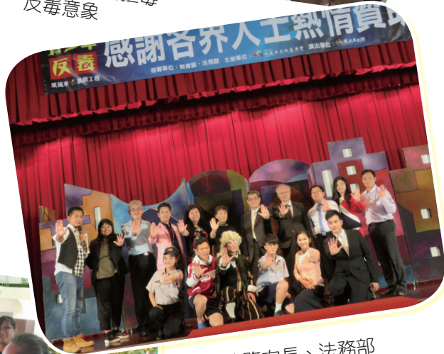
▲ 蔡政務次長、法務部張次長斗輝與演出人員擺出拒毒手勢