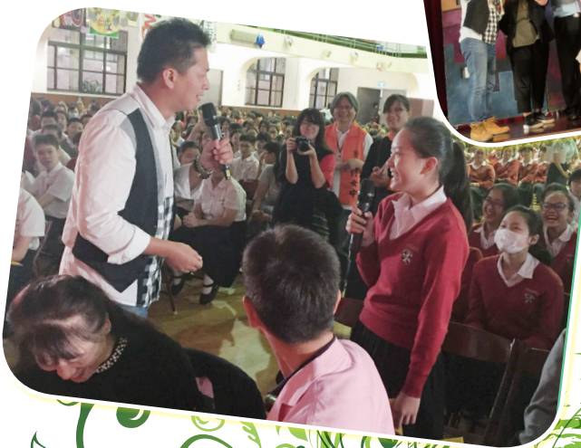
◀ 活動主持人與現場參與學生進行互動問答

國民中學、觀看人數達34萬餘人，後續仍會與各縣市學校以及教育機關合作，將青少年反毒戲劇工程推廣至全臺所有國中，讓更多學生能瞭解毒品危害，建立「吸毒=不歸路」的警世觀念，進而學會拒毒技巧，一起營造友善、純淨的無毒健康校園。（校園安全防護科 王傑）