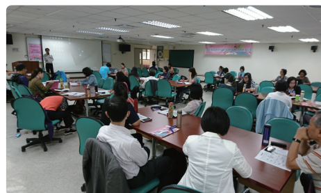
為南區研習培訓會場

擾或性霸凌防治準則」第2條規定，積極推動校園性侵害、性騷擾及性霸凌防治教育，以提升教職員工及學生尊重他人與自己的身體自主權，進而建構友善校園環境，以保障學生之學習權益，有效促進性別地位之實質平等。