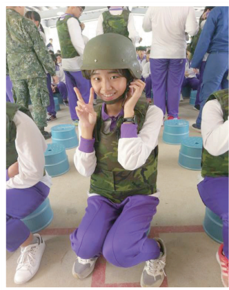
筆者於射擊前拍攝

像中來得容易，而是要經由反覆練習才能達到成效；也因這次經驗，讓我了解到軍人的艱辛。我想在此向保衛國家的軍人將士們致上最深的敬意！因為有你們，才使得我們能過著安居樂業的生活。