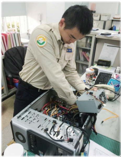
維修處室電腦設備

服役至今的十個月來我秉持著「擇你所愛，愛你所擇」的態度去面對每個境遇，縱使會有不甚如意的事情，但那些都是讓我成長的契機。白駒過隙，光陰似箭，剎時也僅剩下短短兩個月的役期。這段時間讓我學習，讓我有所收穫的其實遠大於我能夠付出的。與役男夥伴的友情、管理幹部夥伴共同努力的情誼、以及長官們的愛戴，這些都會是我難忘的回憶。同樣都是一年，我們如何選擇這一年的服役生涯，可以過得很精采，也可以讓自己苟且虛度，但是多年以後回頭來看，我會希望現在的自己怎麼選擇呢？人生不能重來，一輩子也就服役這麼一次，花再多的錢也買不到這一年的回憶，我想，讓我再次選擇，我仍會撕下相同的志願，選擇同樣的路。