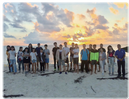
全體學員與東沙日出合影