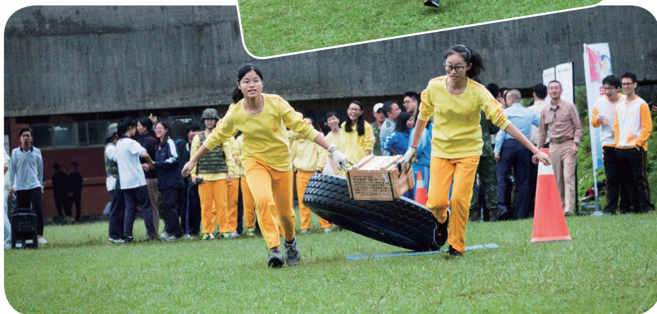
▲ 國防體適能戰技競賽-彈藥補給