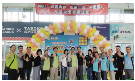
106年桃園市友善校園宣導活動參與貴賓合影

為貫徹行政院提出的「新世代反毒策略」及鼓勵青年學子培養正當休閒活動，同時加強宣導遠離毒品危害，桃園市學生校外生活輔導會於106年10月21日假太魯閣棒壘球場中壘館舉辦「飛揚青春、"籃"截三害、你最棒！」活動。