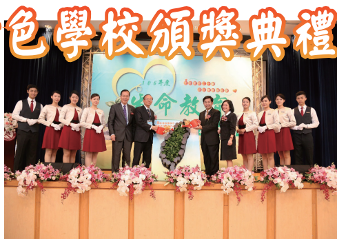
▲ 教育部潘部長進行「活出生命、擁抱愛」的澆灌儀式

今年適逢校園推動生命教育第20個年頭，為象徵走過的每步路都彌足珍貴，除邀請三之三幼兒園小朋友以繪本演繹人生故事，更舉行「活出生命、擁抱愛」的澆灌儀式，期許各級學校及師長持續用愛灌溉教育園地，引領學子能自由揮灑，開創出屬於自己的一片天，並將生命教育推廣至社會每一個角落。（學生事務科 楊奕倍）