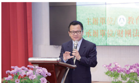
▲ 鄭司長於賃居工作研討會致詞

教育部自99年即積極推動賃居訪視並建構校外賃居服務平臺（資訊網）、提供法律諮詢（糾紛調處）服務及推動外宿學生安全認證工作，在各校持續努力下，已達到初步之成果；另於100學年度更要求高級中等以上學校全面結合警政、消防、建管等跨單位合作，共同推動「學生外宿安全評核」工作，置重點於防範一氧化碳中毒、消防及安全設施的檢視，並引導學生完成逃生演練，降低危害發生可能性。未來教育部仍會考量學校訪視評核人力負荷及兼顧學校服務能量，持續推動賃居訪視及安全評核工作目標，積極維護學生賃居安全及營造優質環境。（校園安全防護科 周緯坤）