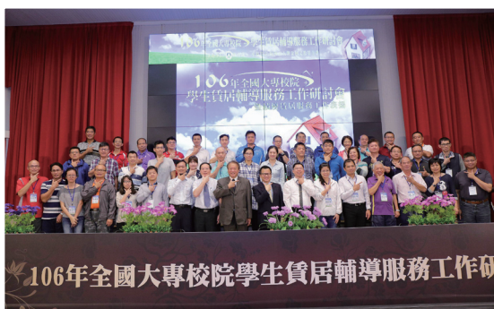
▲ 鄭司長與獲獎績優學校及個人開心合影