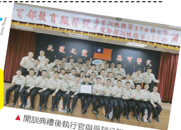
▲開訓典禮後執行官與受訓分隊長合影

想想在我的生命裡，享受社會給我的服務遠遠大於我替社會所曾做過的。我會選擇替代役而不是常備役的原因，也是因為替代役在當今的環境裡，有更多服務社會的機會。