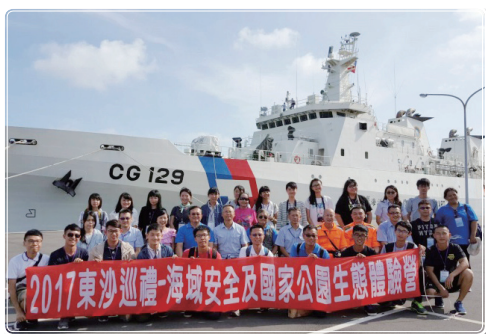
全體工作人員、學員與高雄艦合影

理解東沙島，透過參與本次活動，並與參與學員討論，我能清楚地感受到學員們，從一開始跟海巡（國軍）弟兄們生疏的應對，及對國家認同、國防戰略、國土安全的陌生，慢慢地與這群皮膚黝黑的官兵熱絡交談、融洽相處，看著他們在烈日下屹立駐守崗位的身影，親身體會島上惡劣的天候、物質的貧乏，親身感受保家衛國不僅是一個名詞，而竟是如此地辛勞，這些點點滴滴，相信已然在學員們的心中建構出國軍之身影與形象，「全民國防」脫離課本後，不僅只是標語，而是在東沙體驗營後深刻烙印在學員的腦海裡。而這趟旅程，我帶著種種收穫及親身感受到海洋資源之珍貴、了解政府在南海主權主張與作為，更見證海巡弟兄堅定戍守海疆的決心與能量，必然會在課堂中與學生分享所見所聞，喚起學生愛國心，激起保鄉護國的意識，將全民國防的種子植於學生心中。