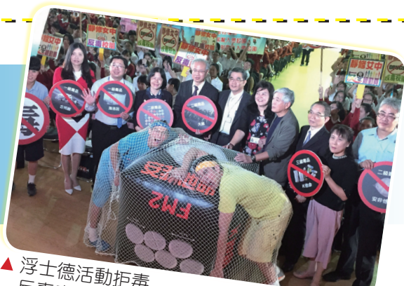
▲ 浮士德活動拒毒反毒意象