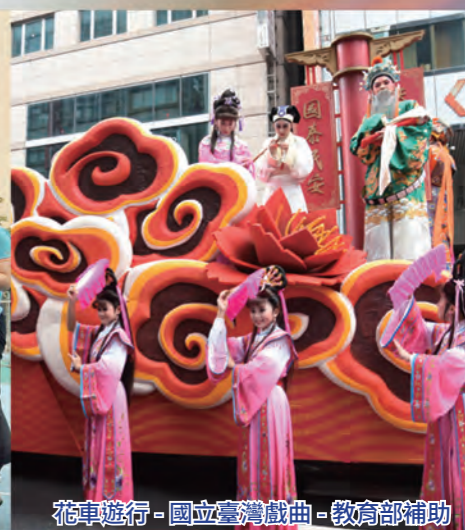
花車遊行 - 國立臺灣戲曲 - 教育部補助