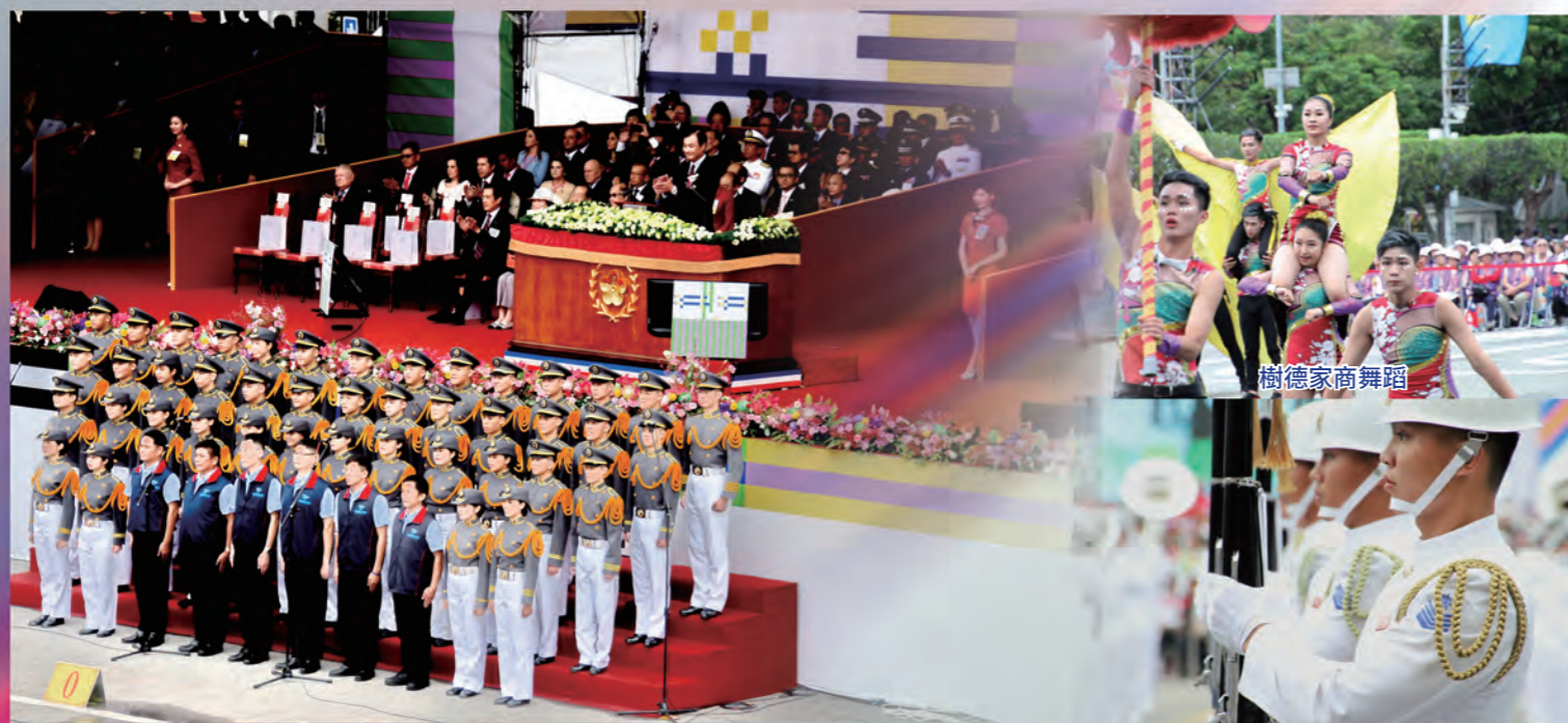
國歌領唱-國防大學及6位燈塔守護者