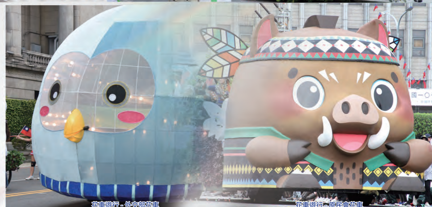
花車遊行-外交部花車