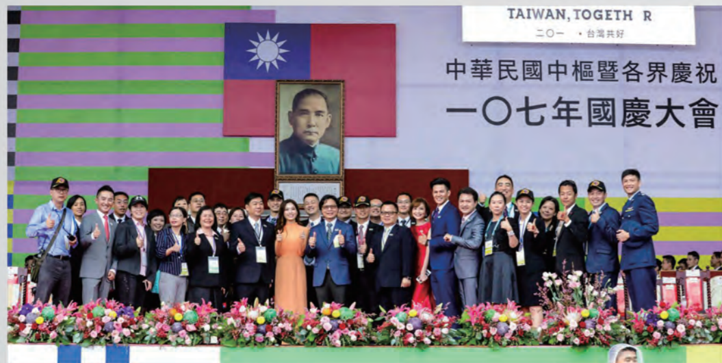
教育部長與慶籌會及主持人合影