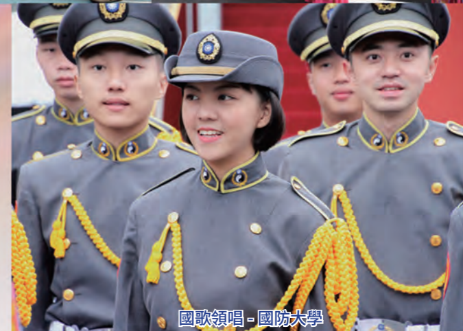
國歌領唱 - 國防大學

遊行；緊接著由哈旗鼓文化藝術團引領第二梯次花車進場；最後的壓軸是由空軍幻象戰機，以五機編隊大雁隊形進行衝場，將慶賀氣氛帶至最高潮，為民眾留下一個難忘的國慶回憶。（國慶籌備委員會計畫組專員邱麗蓉）