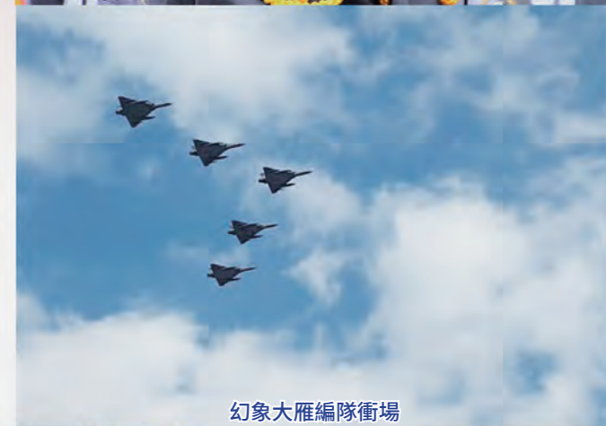
幻象大雁編隊衝場