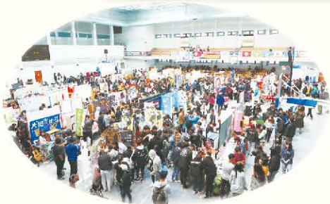
▲ 108 年全社評社團成果資料觀摩展一隅

教育部為協助大專學生社團的健全發展，並獎勵學生參與社團經營的成果，今年於實施計畫推動擴大參與，有別於以往固定每校各推薦 2 名社團參與評選之方式，自 108 年起各校得以登記社團數規模推薦名額 2 至 4 名社團參與評選，讓各校的社團參與比例提升，落實推廣大專學生參與社團發展的精神，並輔導各校社團的發展與傳承更加精益求精。(學務科 吳明杰)