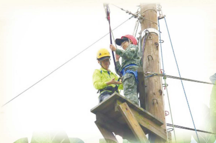
▲合理冒險課程 - 單索