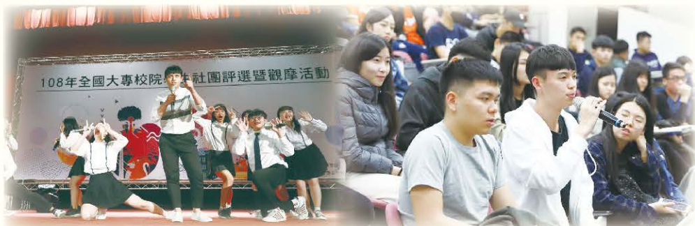
▲ 各校菁英齊聚一堂展現最佳特色

教育部為協助大專學生社團的健全發展，並獎勵學生參與社團經營的成果，今年於實施計畫推動擴大參與，有別於以往固定每校各推薦 2 名社團參與評選之方式，自 108 年起各校得以登記社團數規模推薦名額 2 至 4 名社團參與評選，讓各校的社團參與比例提升，落實推廣大專學生參與社團發展的精神，並輔導各校社團的發展與傳承更加精益求精。(學務科 吳明杰)