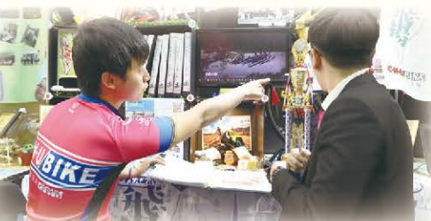
▲ 社團代表用心呈現成果表現自身最大特色