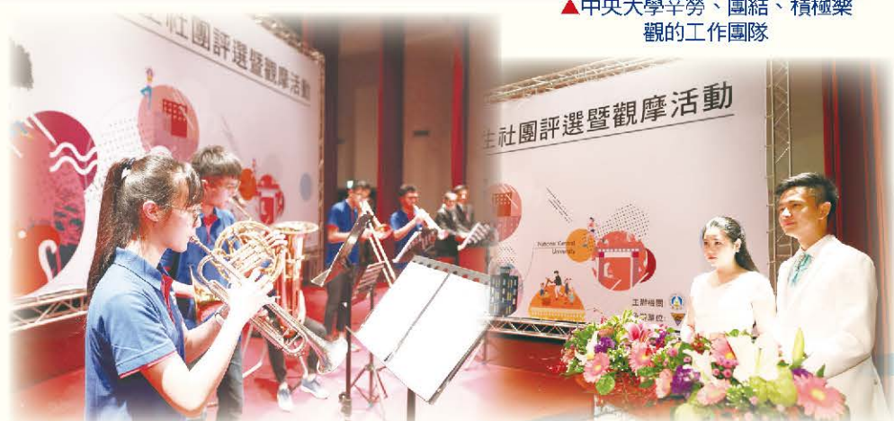
▲ 中央大學管樂社為這次活動拉開序幕