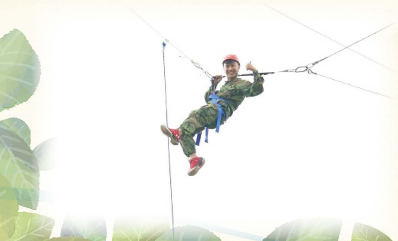
▲合理冒險課程 - 大擺盪