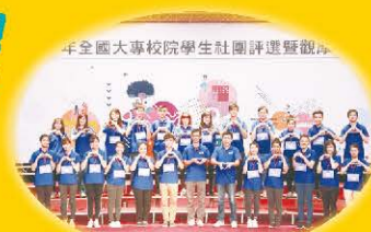
▲ 中央大學辛勞、團結、積極樂觀的工作團隊

今年全社評的標語是「我在中大路上」，象徵著全國社團的菁英遠道而來、齊聚一堂，在中大路上追尋自己夢想與志趣的路上勇敢前進。中央大學將開幕式及頒獎典禮辦理戶外同步轉播，克服場地限制連結場內外社團人一同參與，場內頒獎氣氛緊張、興奮，場外歡呼聲不斷，各校參與的師生熱情不減、秩序良好，體現大學生的公民素養與精神。