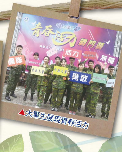
▲大專生展現青春活力