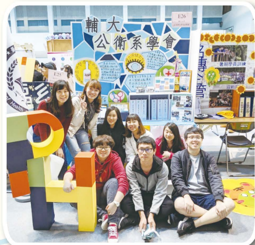
▲輔仁大學公共衛生學系系學會

參與 108 全社評是一個里程碑，但這不會讓我們因此而停滯，為了系上變得更溫暖、使大家都成為更好的自己，系學會不只是單純服務他人或辦活動的學生組織而已，它更教會了大家什麼是「愛」。