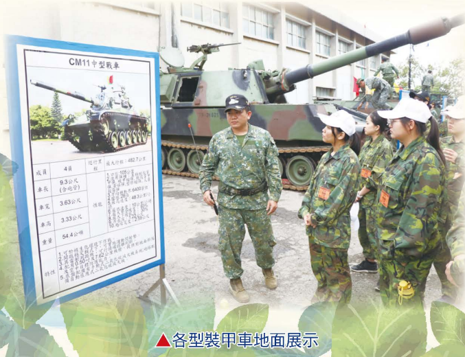
▲各型裝甲車地面展示

BB彈「槍林彈雨」發射的力道打在面罩上，發出「鏗鏘鏘鏘」的聲音，接著是不斷地臥倒及匍匐前進，雖然最後沒能即時找到逃生口，導致小隊營救任務失敗。但黑暗中的我們即使經歷一次次跌倒，卻依然撐起身子勇