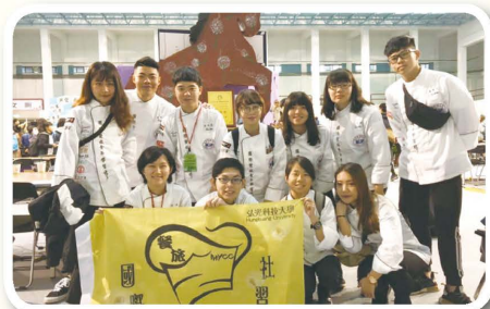
▲弘光科技大學國際餐旅青年學習社