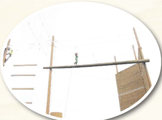
▲合理冒險課程 - 獨木橋

敬佩和感謝，感謝他們的支撐和勇敢，使我們擁有平靜的生活！（國立暨南國際大學諮商心理與人力資源發展學系 李欣怡）