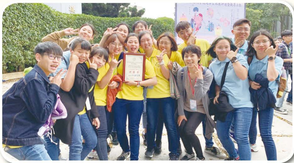
▲台南應用科大熱帶魚康輔社

最後我們也終於拿下佳績，謝謝這次的經驗，經驗的累積會使我們更加的成長，謝謝全社評！