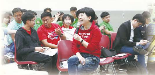
▲ 社團指導老師座談激發社團輔導策略