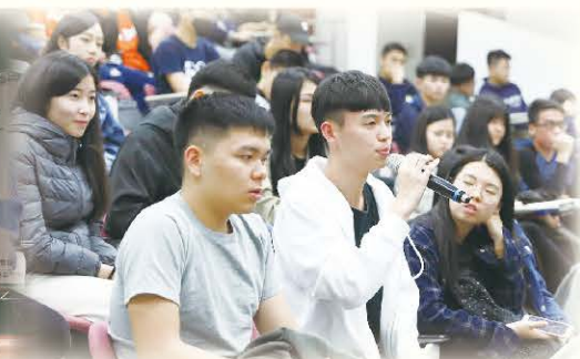
▲ 社團間的互動激盪出更加的發展策略