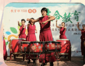
▲ 迎賓曲-鼓隊及腰鼓表演