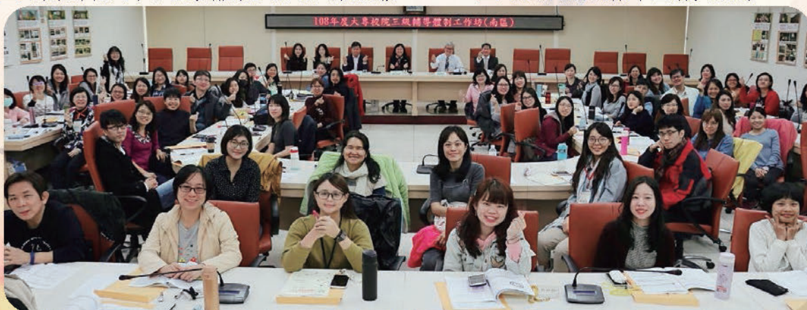
▲ 南區場次分享活動合影