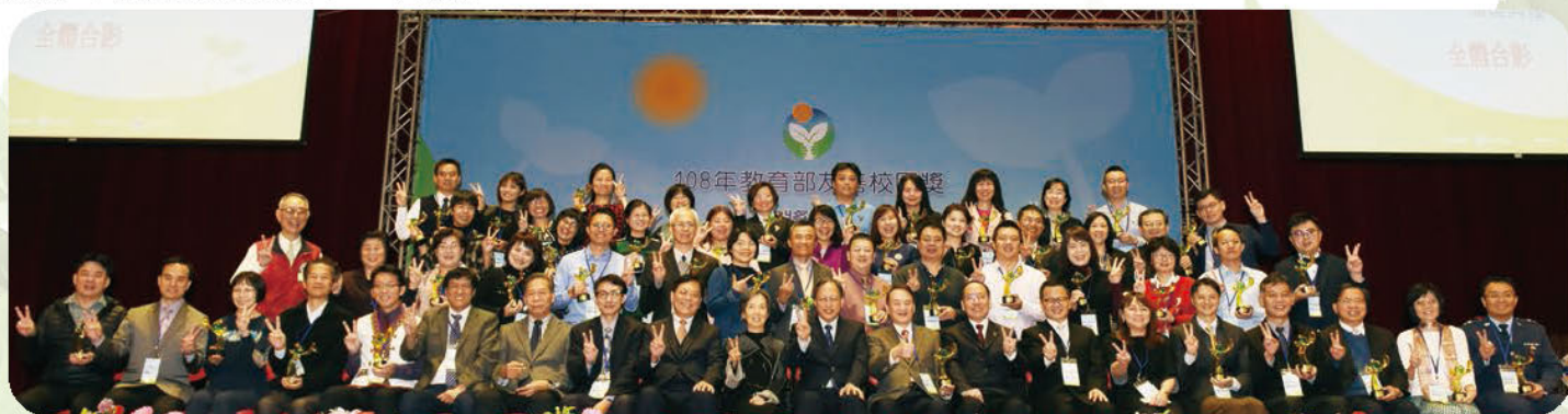
▲ 教育部友善頒獎典禮大合照

感謝所有學輔夥伴的付出與用心，期盼在親、師、生共同攜手合作下，構築尊重、包容與安全的友善校園，讓學生們在校園中，安心學習並實踐夢想。(學務科 何依娜)