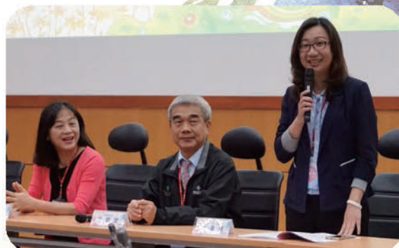
▲ 黃專門委員假中區場次致詞