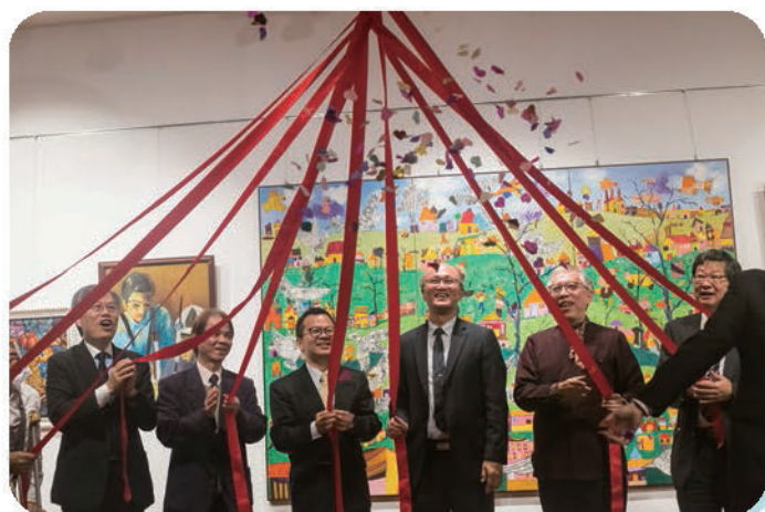
▲ 與會貴賓一同拉開飄散愛心圖樣的彩球為畫展揭幕