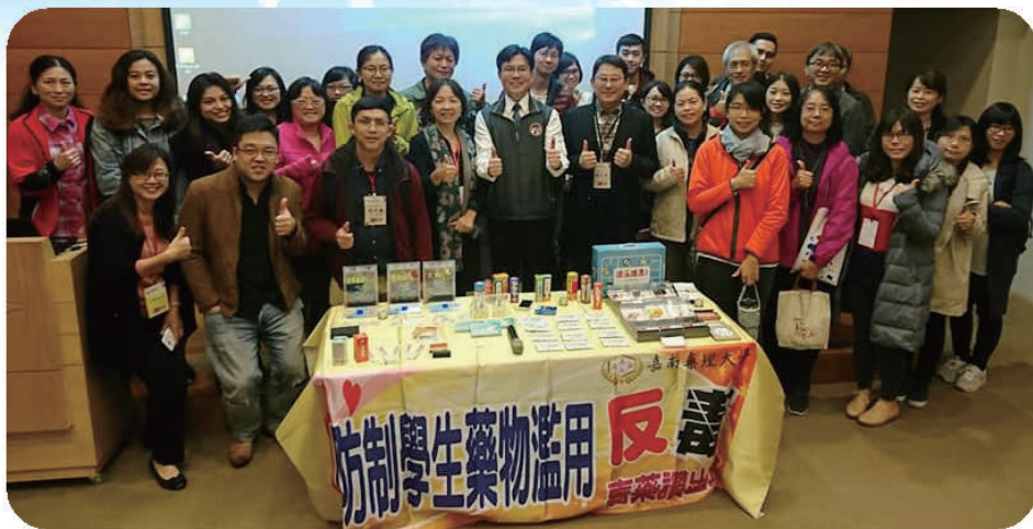
▲ 教育部強化大專校院輔導人員「網路成癮及藥物濫用防治輔導」