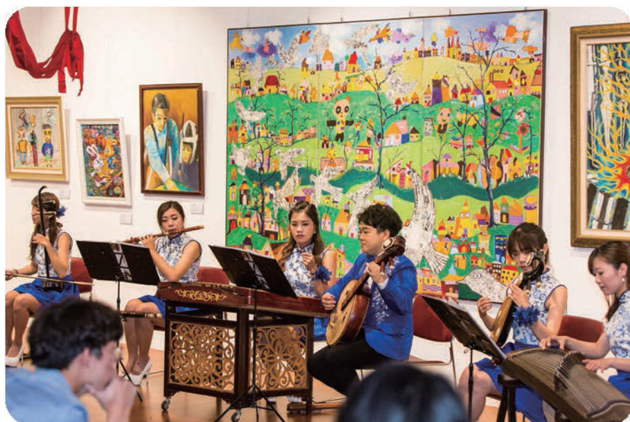
▲ 國立臺灣戲曲學院絲竹樂團帶來精彩演出