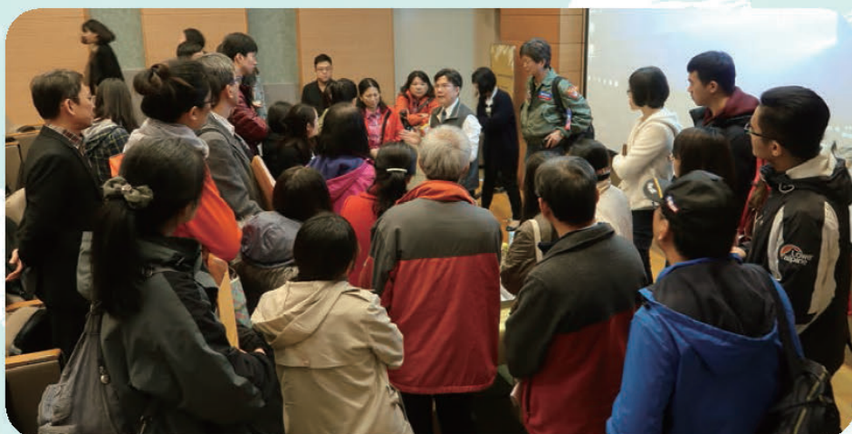
▲ 「網路成癮及藥物濫用防治輔導」