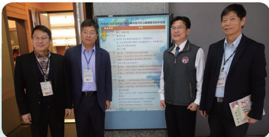
▲ 教育部強化大專校院輔導人員