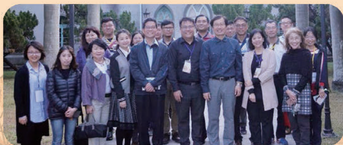
▲ 南神神學院校園-大合照