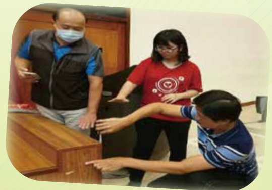
▲ UCAT學員丈量講台是否符合規範高度