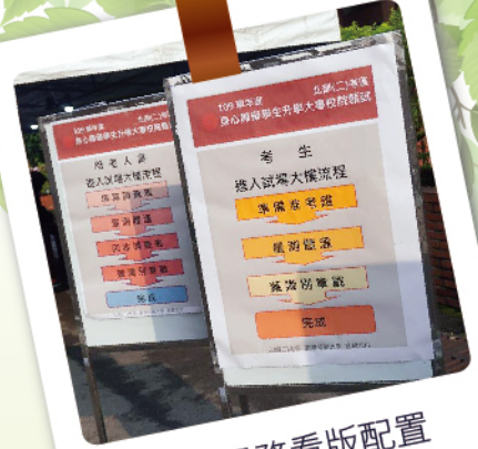
考場服務看板配置

甄試分別於淡江大學、國立臺灣師範大學、致理科技大學、國立臺北教育大學、國立彰化師範大學、國立高雄師範大學及國立東華大學7考區舉辦。今年報名人數較108學年度增加28人，其中北部(一)考區706人、北部(二)考區558人、北部(三)考區323人、北部(四)考區239人、中部考區651人、南部考區656人、東部考區37人。加考「美術」術科考生，其中北部考區99人、中部考區20人、南部考區36人、東部考區2人，合計157人；加考「音樂」術科考生12人。