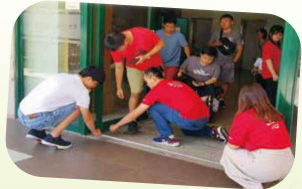
▲ UCAT學員丈量無障礙廁所鏡子是否符合規範(2)