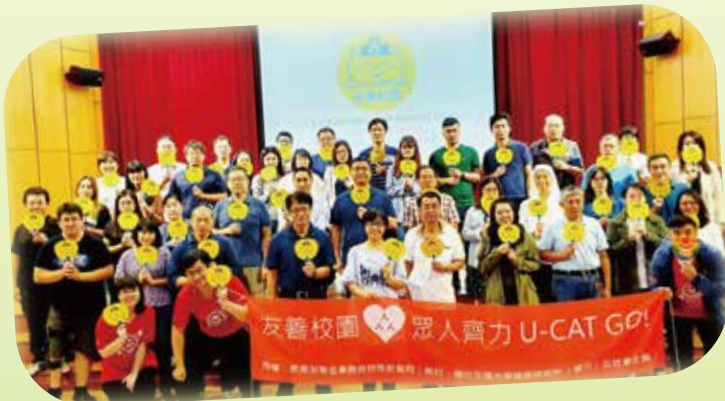
▲ 國立彰化師範大學校園無障礙資訊平台建置與培力與培訓計畫