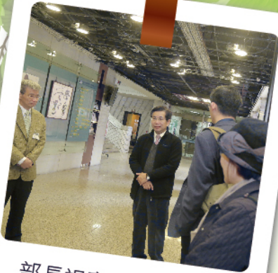
部長視察考場及動線