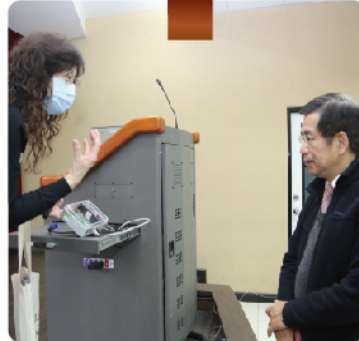
試務人員說明教室 裝設CO2即時監測