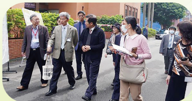
▲ 潘部長巡視台師大考場