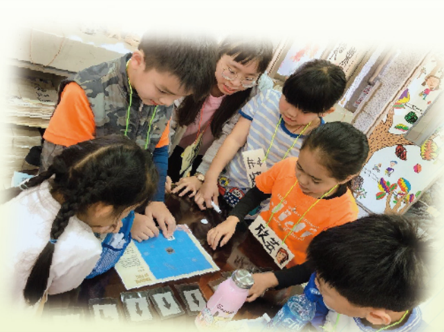
▲ 同心協力完成任務

教育部為鼓勵各大專校院落實大學社會責任 (USR)，強化教育優先地區中小學生參加課外活動營隊，特補助大專校院學生社團經費赴各中小學校舉辦免費寒假營隊，讓教育優先區的學生也能過一個充實、溫暖又精彩的寒假！