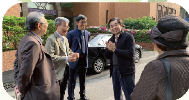
▲ 部長視察考場並感謝試務人員辛勞

針對「新型冠狀病毒肺炎」疫情，身心障礙甄試委員會業依照「大學辦理招生考試防疫措施指引參考原則」等相關注意事項辦理，例如，試場環境通風與消毒部分，全數試場包括考生桌面、門把、電燈開關等考生可能經常接觸的地方，全部以稀釋漂白水消毒，甄試結束再次消毒，預備酒精供監試人員及考生清潔使用，對於考區接駁車也進行消毒，包括車內座椅、扶手拉環等處於每日出車前、收班後確實清潔並以稀釋漂白水消毒；另外，對於進出試場大樓的相關人員進行體溫量測，增設備用試場提供考試當日需求啟用等，強化考場各種防護措施，以確保考生於安全環境參加考試。