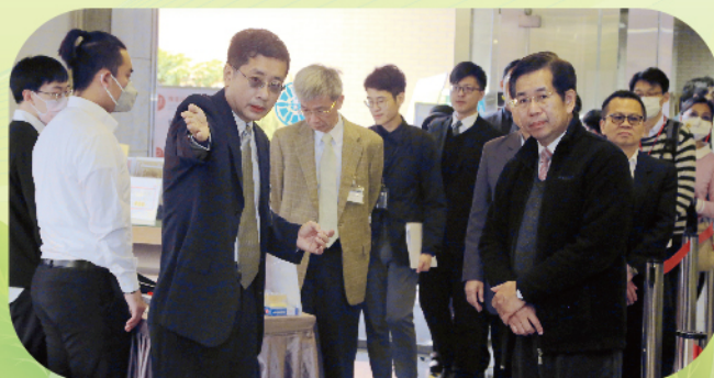
▲ 試場出入口檢疫措施