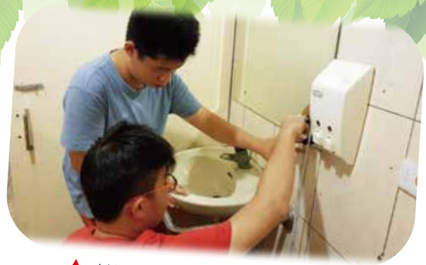
▲ UCAT學員丈量無障礙廁所鏡子是否符合規範(1)

教育部學生事務及特殊教育司強調，「UCAT大專院校無障礙校園資訊地圖」試辦計畫不僅結合科技與人文創新，創造一個能便利身障師生的跨學校資訊服務平臺，不同障別使用者能透過統一平台檢索無障礙資訊；更重要的是培訓各校的身障同學運用自己不方便的经验，建置自己學校的無障礙資訊，在專注學業外也能積極參與校園生活，服務更多有需要的伙伴，成為最友善的校園無障礙大使，進一步將無障礙的觀念推廣給每一個人，打造友善校園及融合教育的學習環境。(特教科 林偉婷)