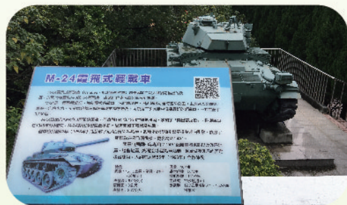
▲ 新北市武器公園陳展及語音導覽QR Code音導覽，讓獨自參觀旅客也能自行瞭解陳展武器各項諸元及性能，為新北市推廣全民國防教育主要場所之一。