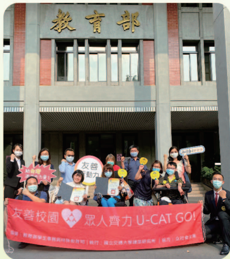
▲ UCAT 頒獎活動大合照

「臺灣大專院校無障礙校園資訊地圖(University Campus Accessmap Taiwan, UCAT)」試辦計畫自107年11月開始執行，於109年3月上線，目前已完成24所大學(48校區)的724棟建築物及9185項無障礙設施(無障礙電梯、廁所、宿舍、