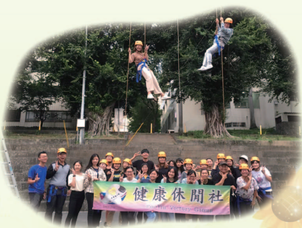
▲ 輔英科技大學健康休閒社

終於！在全國學校，藏龍臥虎，競爭激烈的情況下，體育性社團最高殊榮的唯一特別獎項「特優」，今年落在了輔英科技大學健康休閒社。正所謂十年寒窗無人問，一舉成名天下知，今年可以說是很特別的一年，因為疫情的影響，評鑑方式也有所調整，沒辦法揮軍北上實際進到全國的殿堂，少了經典的社團佈場，也少了隆重的儀式典禮，一切改以電子化的審查方式。在這樣的環境條件之下，突然的制度改變，健康休閒社也迅速反應，配合政策來調整，持續努力的去準備該有的審查資料，一點也不馬虎，甚至準備過程中的煎熬及苦悶，讓許多社員一一選擇來離去。不過事實證明，機會永遠是留給準備好以及堅持到最後的人，在此又為我們健康休閒社留下了個光榮的歷史，增添一筆傲人的成績恭喜！