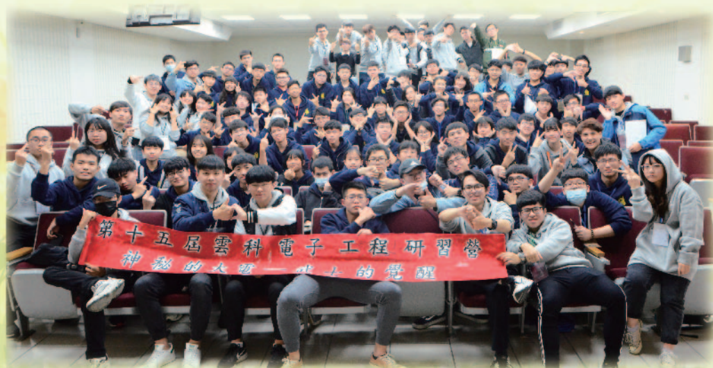
▲ 國立雲林科技大學電子工程系系學會

在我去年上任會長時，學長們帶領著電子系學會在107學年度拿下了三座特優，107年度彰雲