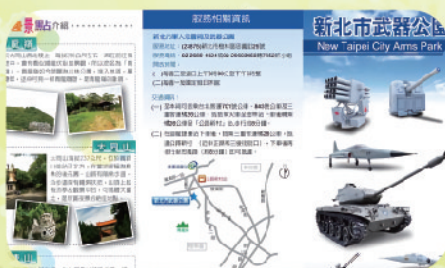
▲ 新北市武器公園摺頁

新北市軍人忠靈祠又名「武器公園」，為全台展示國防武器最大規模的公園，園區內陳展多項國軍汰除武器，如戰車、戰機、飛彈及火箭等；結合當地大同山登山步道並設置鐵馬驛站，提供各年齡層旅客不同服務需求。結合地方觀光產業內容提供團體導覽服務申請，另提供16項軍武設備中文語