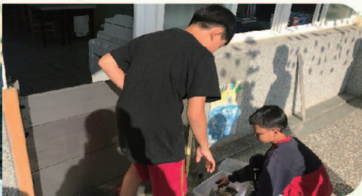
▲ 國小學生裝設防水閘門