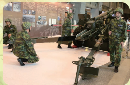
▲ 八二三砲戰60週年紀念展-展覽105榴炮並實施砲操表演