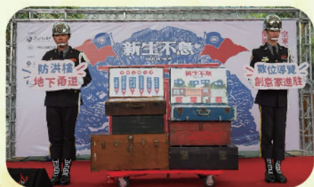
▲ 空軍三重一村舉辦眷村文化節活動

空軍三重一村在新北市政府文化局積極推動整復工作下，轉型為「新北眷村文化園區」於107年11月正式對外開放，除保存了原有的眷村風貌，結合現代科技投影技術還原當年眷村生活模樣，提供樂活創意家駐村申請，園區內辦理各式各樣的懷舊活動並提供空間展示文藝作品，活化軍事古蹟運用，有效利用文物空間，讓參觀民眾有耳目一新的感覺，每年參觀人數增加更能顯示市府對推展全民國防教育工作不遺餘力。