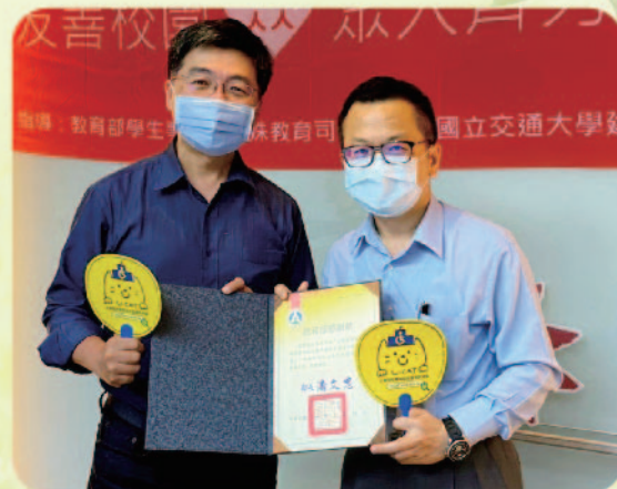
▲ 司長與侯所長合照