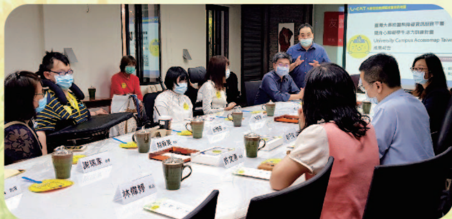
▲ 頒獎活動UCAT 成果發表

教室、會議廳、運動設施等)登錄，民眾只要透過電腦或手機連上網站就能隨時查詢，也能直接在線上瀏覽現場照片，確認是否符合需求，使用後還能線上提供回饋建議，讓校園愈來愈友善便利。(特教科 林偉婷)