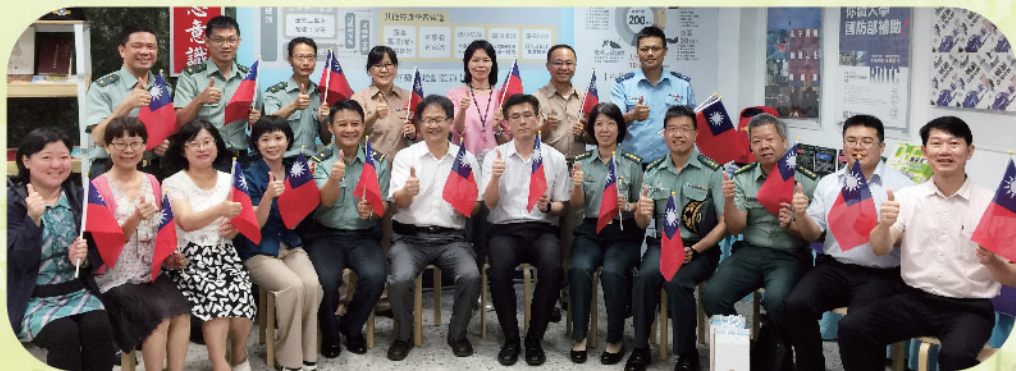
▲ 市立三重商工全民國防情境教室參訪人員合影