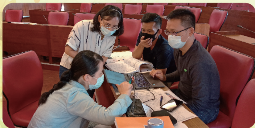
▲ 各組針對分配任務進行討論及意見交換

生思考、發想與討論。為使素養導向教學活潑生動，學科中心將課綱主題之一「災害防救與應變」及各項校園安全場景，導入兵棋推演概念後，嘗試研發一款桌遊教案，主題以全民國防教育防衛動員及災害防救為中心，遊戲或以團體決策或個人闖關模式進行遊戲，並設計相關情境及狀況加入桌遊的卡牌狀況題，結合校園地圖或學生切身生活環境等設計地圖，加入些許運氣成分(如擲骰子、抽牌)等，讓遊戲增添刺激性，期能以貼近學生周遭的狀況或事件來設計，遊戲參與者才有共鳴，引發決策團隊發想，使學生在操作遊戲後能留下深刻印象，增強對突發事件及災害防救的應變能力。(國防科 陳建欣)