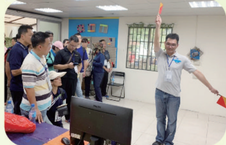
▲ 教育部108年軍訓人員暑期工作研習-運用Kinect動態辦視裝置設計「旗語」闖關活動

新北市政府依據「全民國防教育法」第4條及國防部年度計畫，策頒年度推動全民國防教育計畫，統籌協調全市各機關、學校及民間團體辦理全民國防教育活動，並以「創新、服務、多元、深入」為主軸，落實推動全民國防教育，培養全民愛鄉愛國意識，奠定國防認知基礎，凝聚全民國防共識，在整體工作上可區分6大特色：