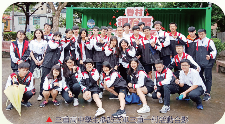
▲ 三重高中學生參訪空軍三重一村活動合影