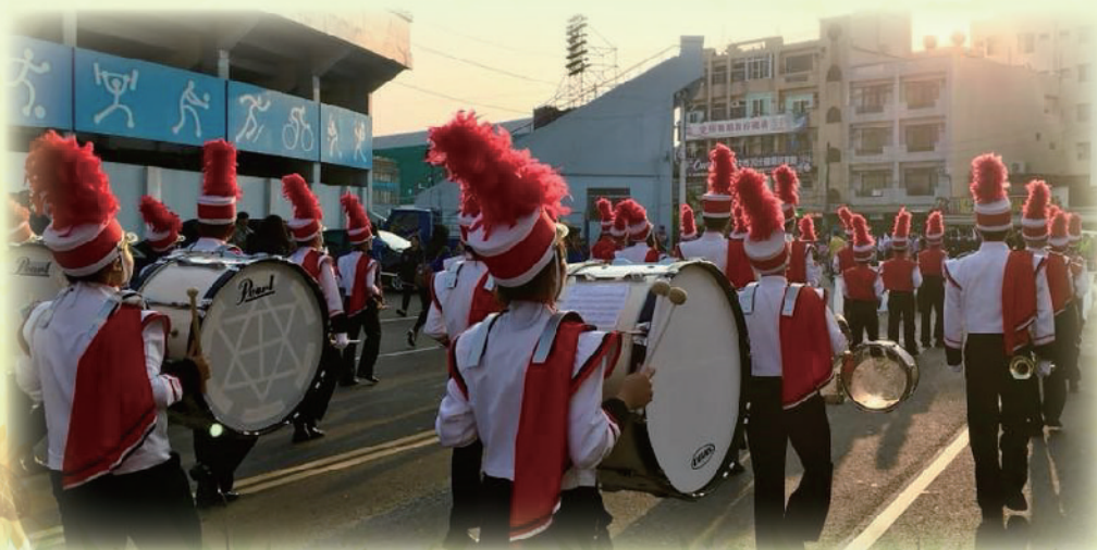
▲ 國立嘉義大學樂旗隊

今年是在樂旗隊的第三年，同時也是我的最後一年。很感謝有這緣分讓我們能相識相聚，也感謝學校願意當我們的後盾，協助我們的表演大小事，謝謝在這旅途上的每一個你。這一次參與全國社團評鑑特色社團活動並得到特優的獎項，也讓我再度以身為樂旗隊幹部為榮。作為全國大專院校唯一的樂旗隊，我們必須要再將樂旗文化傳播到更遠的地方，讓更多人知道我們國立嘉義大學樂旗隊。(學務科 李靜慧)