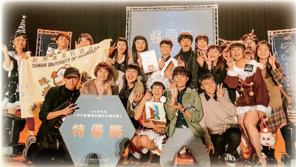
▲ 台南應用科技大學熱帶魚康輔社

大學社團之中大概沒有與在2013年自校隊轉型成為社團的樂旗隊類似的社團。在短短幾年內，樂旗隊從一個只有6、7人的社團演變成一個超過20人的社團。除此之外，透過社員們的努力以及毅力，讓教育優先區國小營