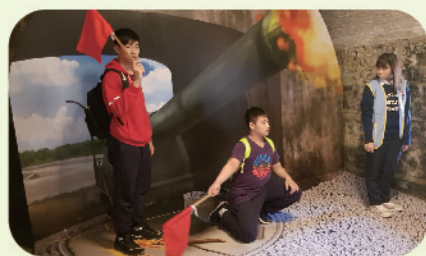
▲ 教育局熱血青春戰滬尾活動-運用Kinect動態辦視裝置讓參加人員模擬火炮射擊動做

碼頭景點，將早期住民商業貿易活動，透過現今科技AR擴增實境技術重現民眾眼前，並將其內容融入解謎題目當中，讓參與人員瞭解早期先民的生活模式及辛勞。此套系統同時也應用在年底的「熱血青春戰滬尾」競賽中，結合當時的陳展主題及設備，以活潑暨休閒的整體規劃，激盪參與同學的腦力、理解力及觀察力，藉以拓展全民國防教育成效。