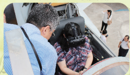
◀ 白雲國小F5-E戰機飛行體驗模擬器