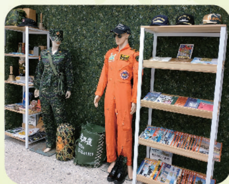
▲ 新北市立三重商工全民國防情境教室陳展物品

市立三重商工建置全國首創全民國防情境教室，配合「翻轉教育」設計為「分組合作教室」，其中包含精神標語、專業書籍展示櫃、階級臂章裱框及軍服展示、國防資訊看板、立體拼圖海報專區、投影式射擊模擬器等設施，提供軍事書籍、雜誌瀏覽，藉由轉換學習場域，提供學子身歷其境的學習空間，以強化精神教育作為。