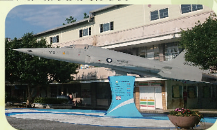
▲ 白雲國小F5-E戰機陳展

新北市汐止區白雲國小是全國唯一擁有戰機的小學。國防部與新北市政府教育局合作將國軍退役F5-E戰鬥機融入白雲國小校園陳展，機鼻向空昂揚展現「飛向白雲」意涵，校方結合VR研發「飛行體驗課程」，讓學生透過課程模擬飛行進而體驗飛行員視野及瞭解飛行樂趣，並實際參觀戰機結構與裝備，進而對全民國防產生興趣，透過身歷其境體驗，建立學子愛家愛國觀念，進一步深化全民國防教育成效。