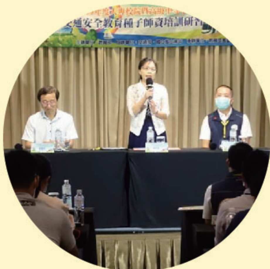
▲ 學務司鄭專門委員 始業式致詞

教育部於8月26日至8月28日辦理「友善交通安全至上一109年度大專校院暨高級中等學校交通安全種子師資培訓」，計120位學員參訓，希望透過有關交通安全法規與實務操作課程設計，使參訓人員具備宣講學生交通安全相關知能，有效防堵學生交通意外事故發生，以強化校園交通安全宣講陣容，達到擴大宣教成效。教育部自98年起每年培訓交通安全教育種子師資，迄今已培訓約1千餘人次師資。