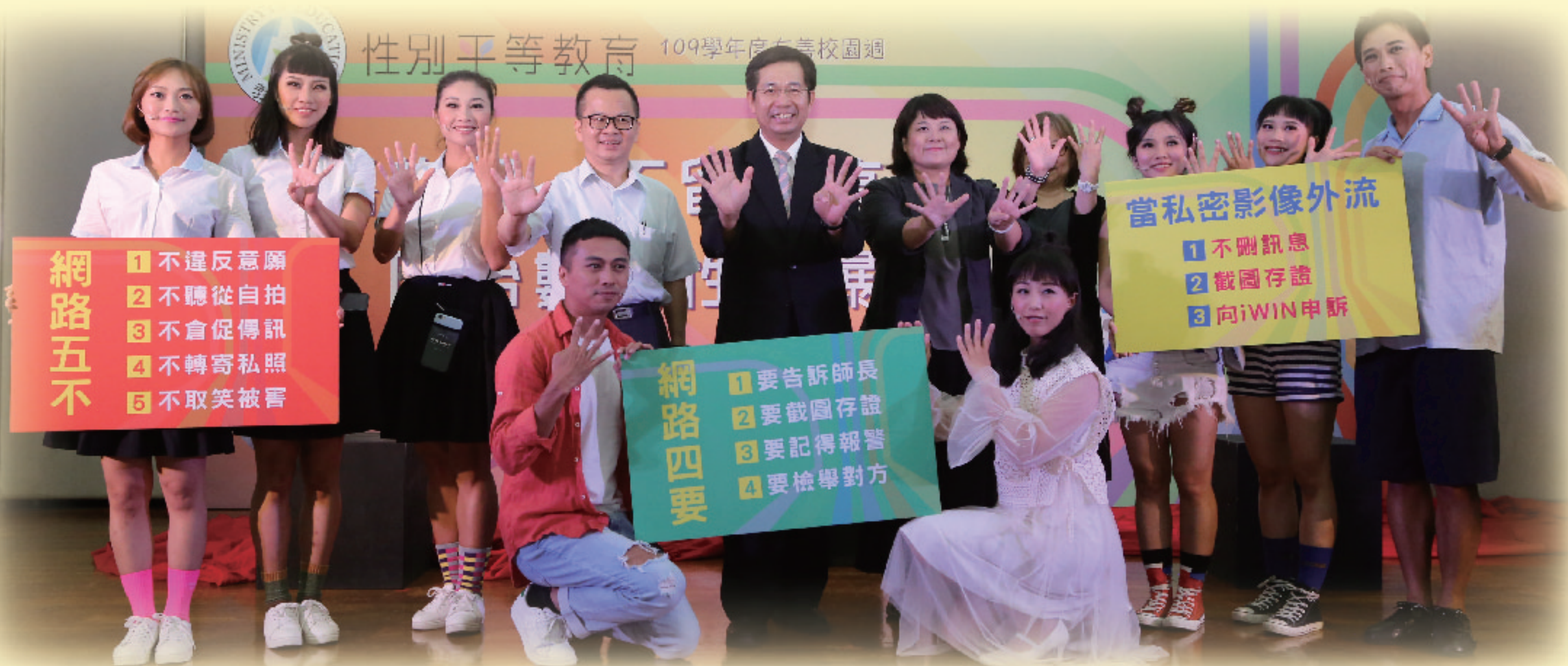
▲ 潘部長、鄭司長、來賓及紙風車劇團一同宣示「五不四要」防治數位性別暴力