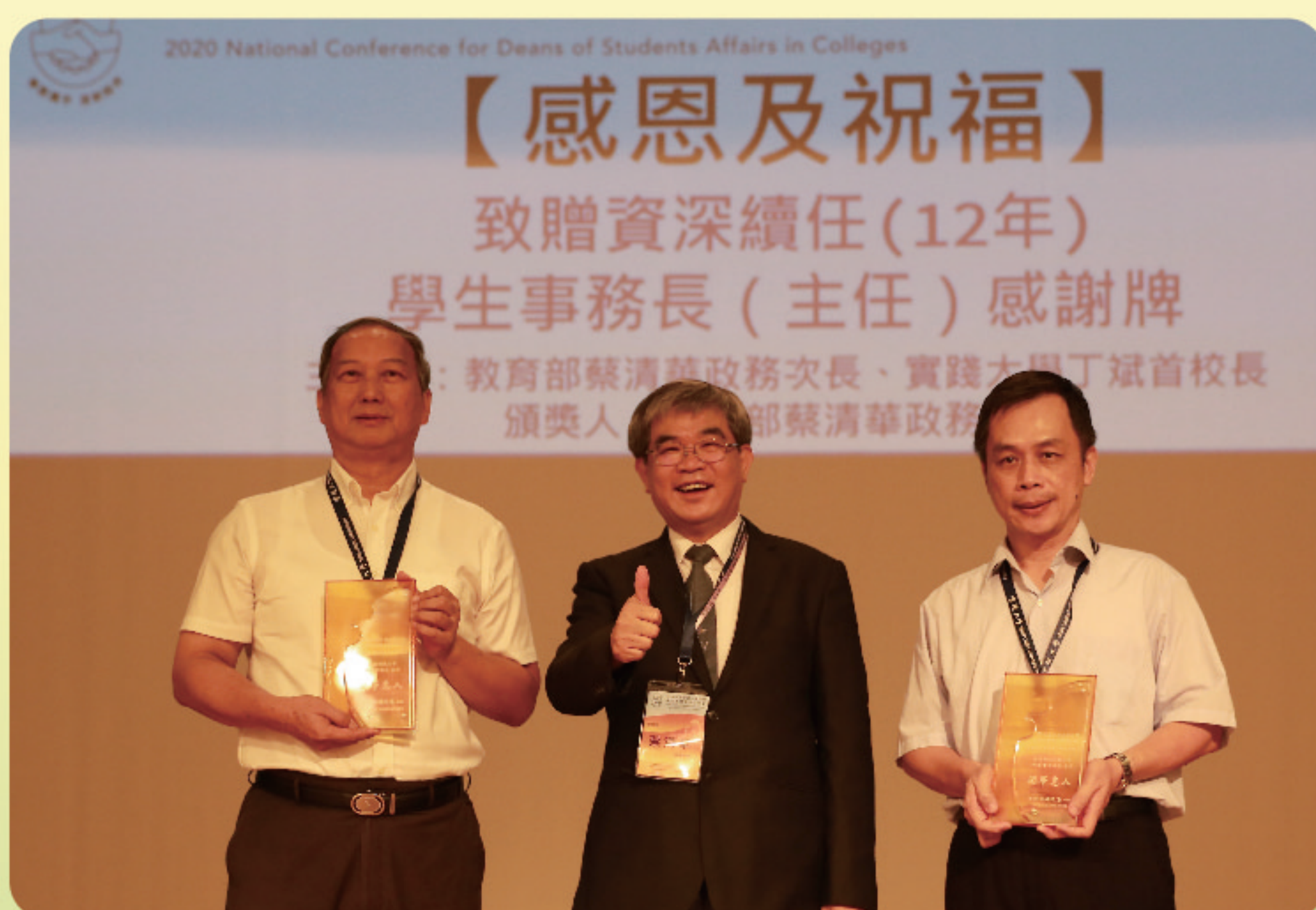
▲ 感恩與祝福-蔡政務次長致贈資深續任學務長獎牌

學生事務工作的願景與目標，除了確保學生安全無虞，更要積極營造友善之校園文化，透過師生相處、課外學習等有意義活動，學習正面思考，可建立新世代優質公民素養。(學務科 張沛儀)