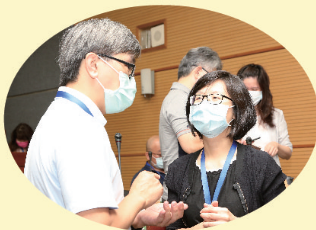
▲ 課外活動主管交流及互動

為增進課外活動組主管的實務經驗交流，瞭解當前學生事務政策及課外活動工作現況，教育部於8月13日在龍華科技大學舉辦「109年全國大專校院課外活動主管會議」，激勵各校工作士氣，以提升大專學生課外活動教育功能。