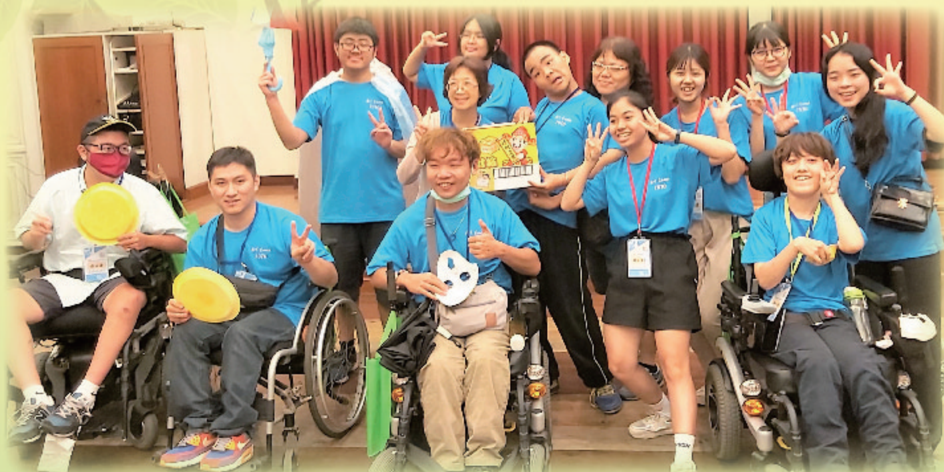
▲ 學生們在晚會表演大展創意「戲」胞

主辦學校國立臺中教育大學副校長侯禎塘表示，夏令營目的是藉由藝術創作課程及藝文活動參訪觀摩，引導不同障礙類別學生進行多元藝術創作體驗課程與藝術探索學習交流，激發想像力和創造力，同時透過適應性藝術體驗活動引領參與學生們探索自我內心和內外在世界的互動關係，增進良好的人際關係。(特教科廖浚羽)