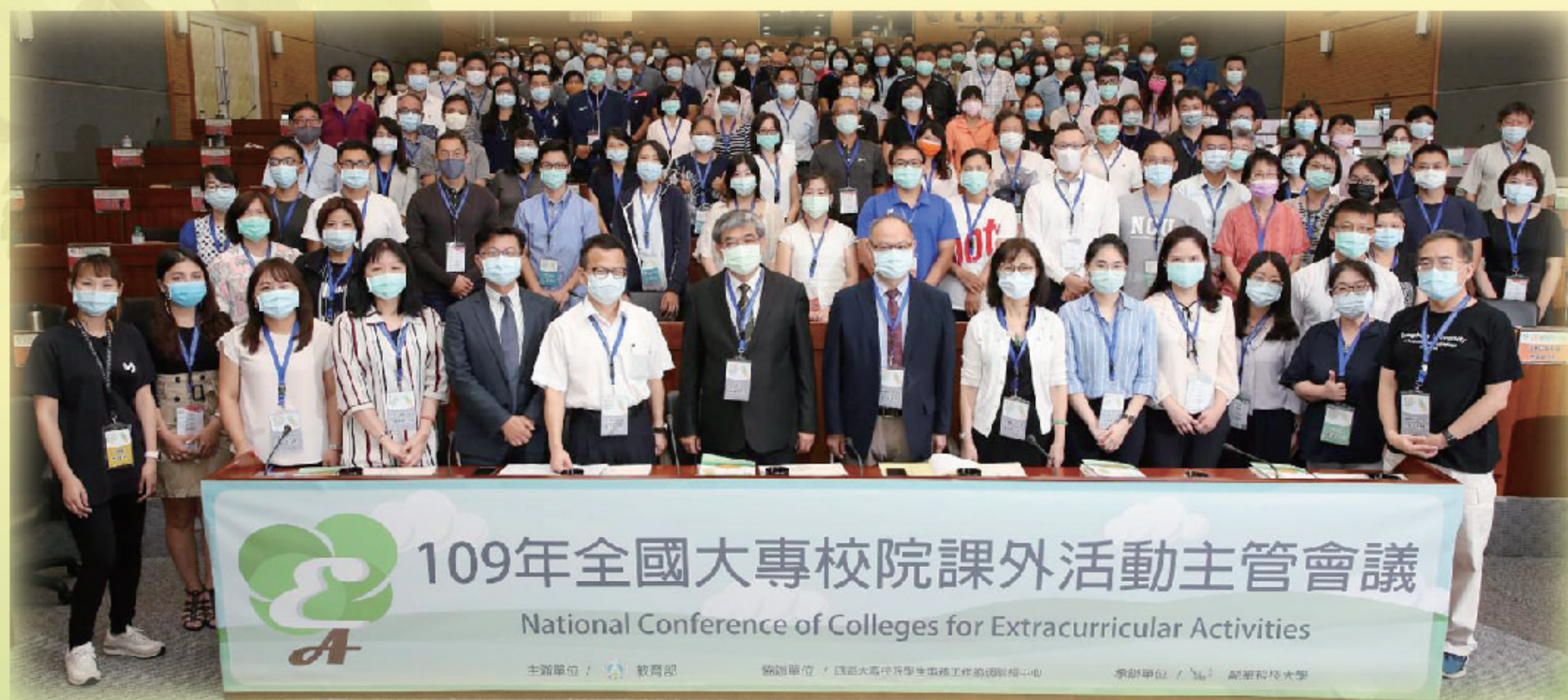
▲ 109年全國大專校院課外活動主管會議大合照

的場域，藉由輔導學生參與社團活動的歷練，進而蛻變為成熟穩重、獨當一面的優秀青年，除感謝學生課外活動工作伙伴的熱情奉獻，也期許學校能夠成為學生的堅強後盾，持續抱持開放態度與學生相互溝通、凝聚共識、因應學生潮流及符應社會發展趨勢，展現大專學生的活力與自信。(學務科 李靜慧)