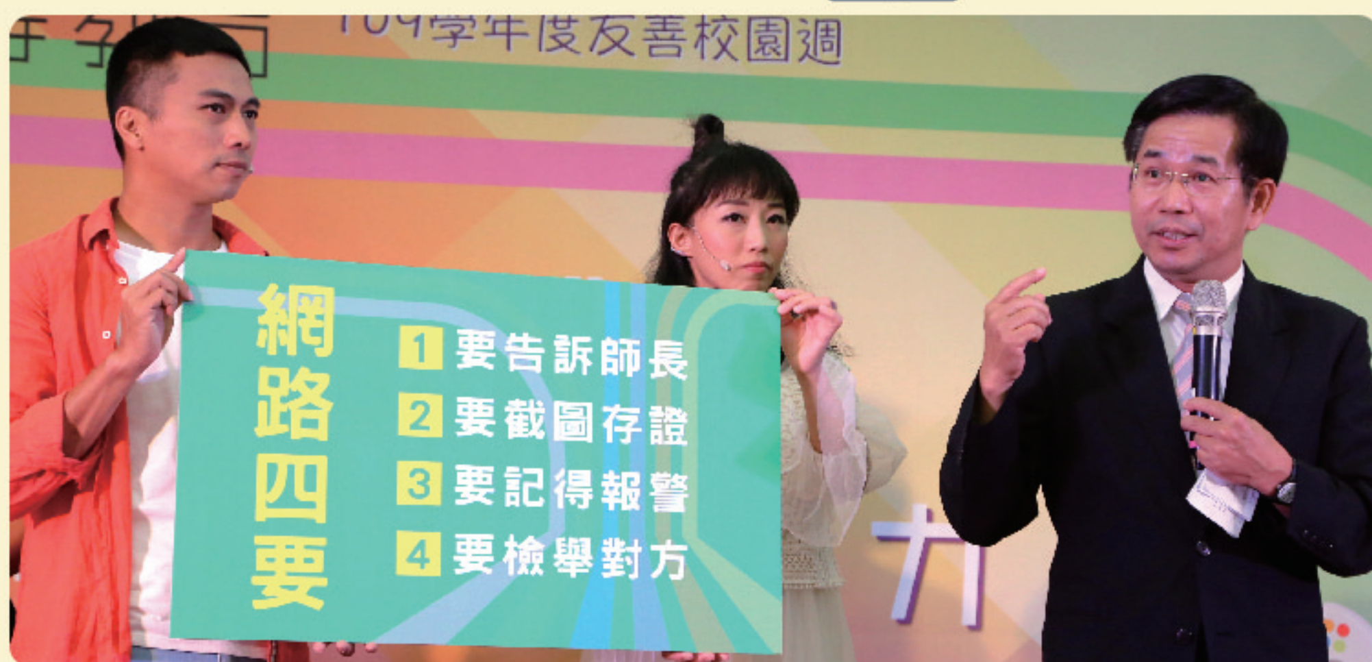
▲ 潘部長致詞，呼籲全國學生遭遇數位性別暴力時，落實「網路四要」

記者會特別邀請紙風車劇團演出學生可能遭受到的網路性別暴力案例：誘騙試鏡、假愛真威脅、照片換遊戲點數及畢旅玩瘋了等，鮮明呈現學生可能遇到的情境。教育部潘文忠部長並提出「五不、四要」的防護守則，呼籲全國學生、家長、老師及社會大眾關注此議