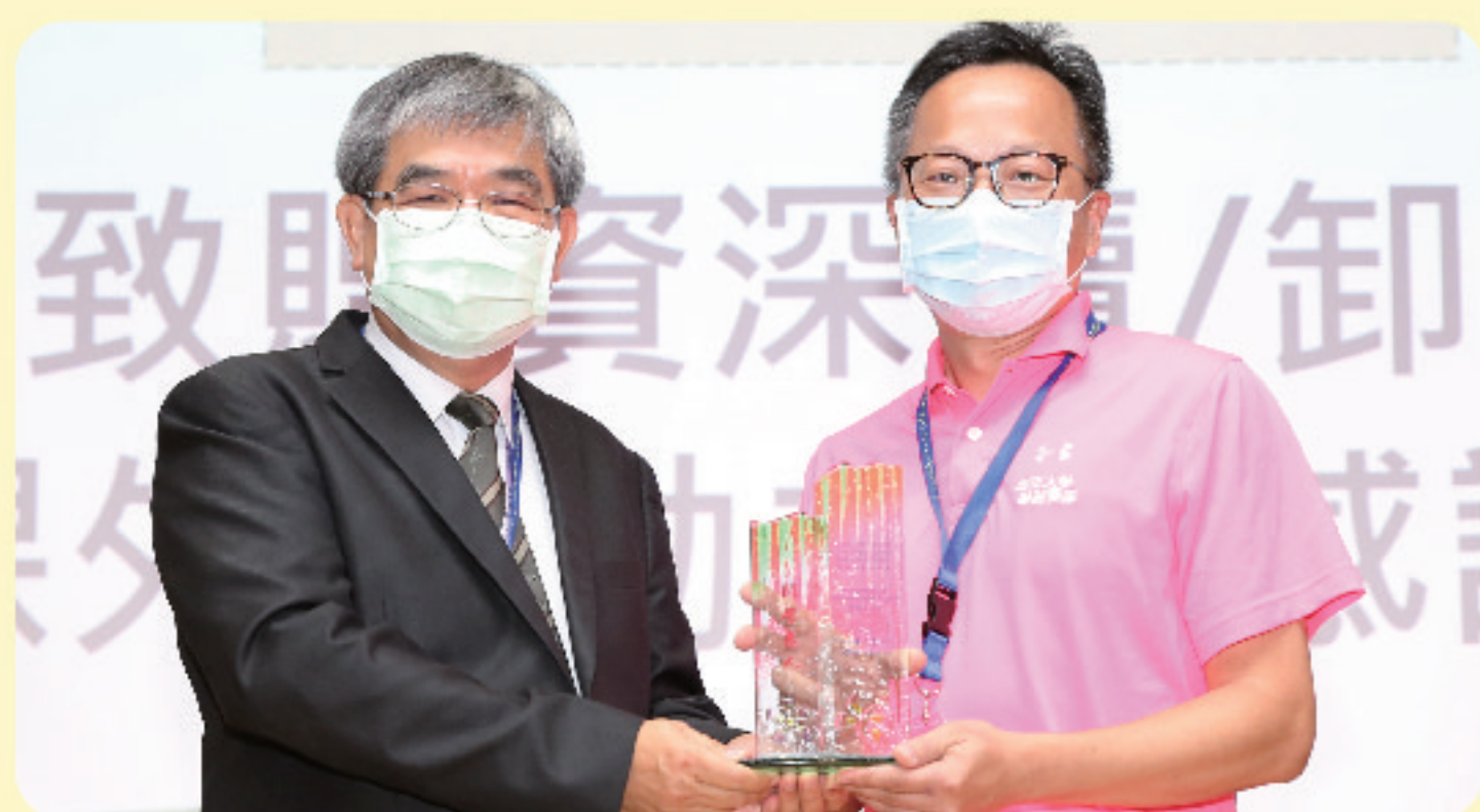
▲ 蔡政務次長致贈資深續卸任課外活動主管感謝牌