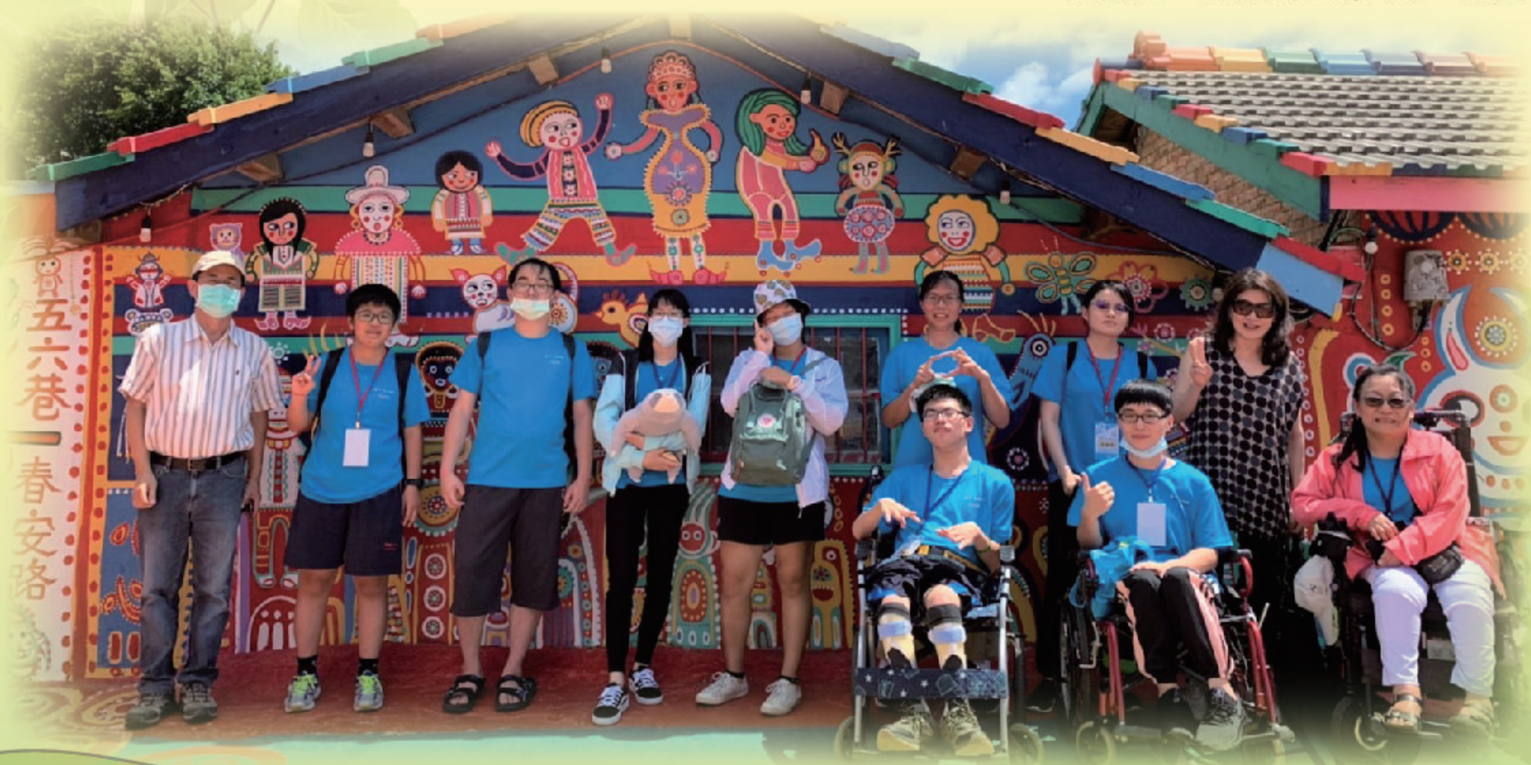
▲ 藝術夏令營的學生們參訪臺中彩虹眷村並合影留念