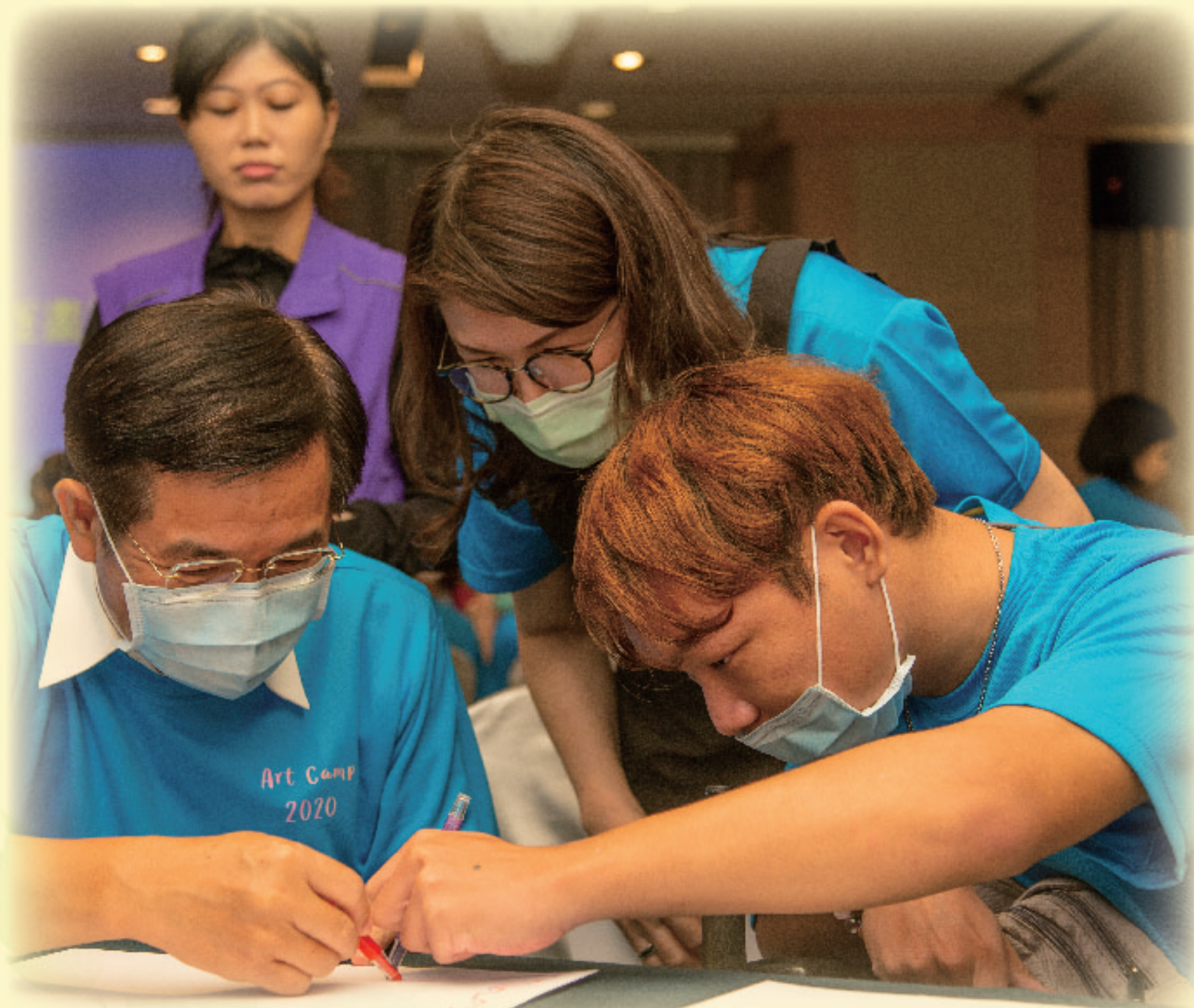
▲ 潘部長與學生共同體驗追逐遊戲畫

教育部為鼓勵身心障礙學生暑假期間積極參與團體活動，自11日起一連4天於臺中及南投舉辦「109年度大專學生適應性表達藝術夏令營」，共計40位