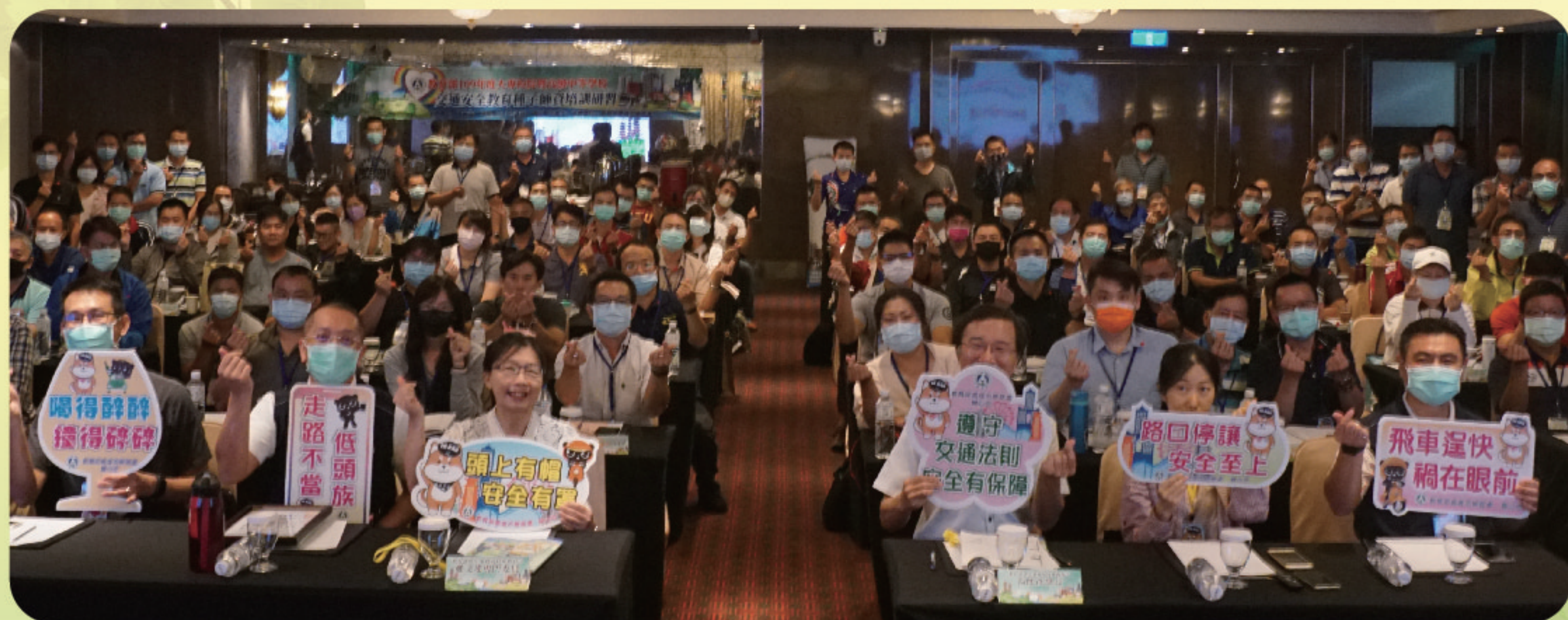
▲ 學務司鄭專門委員、交通部湯組長與受訓學員合影留念