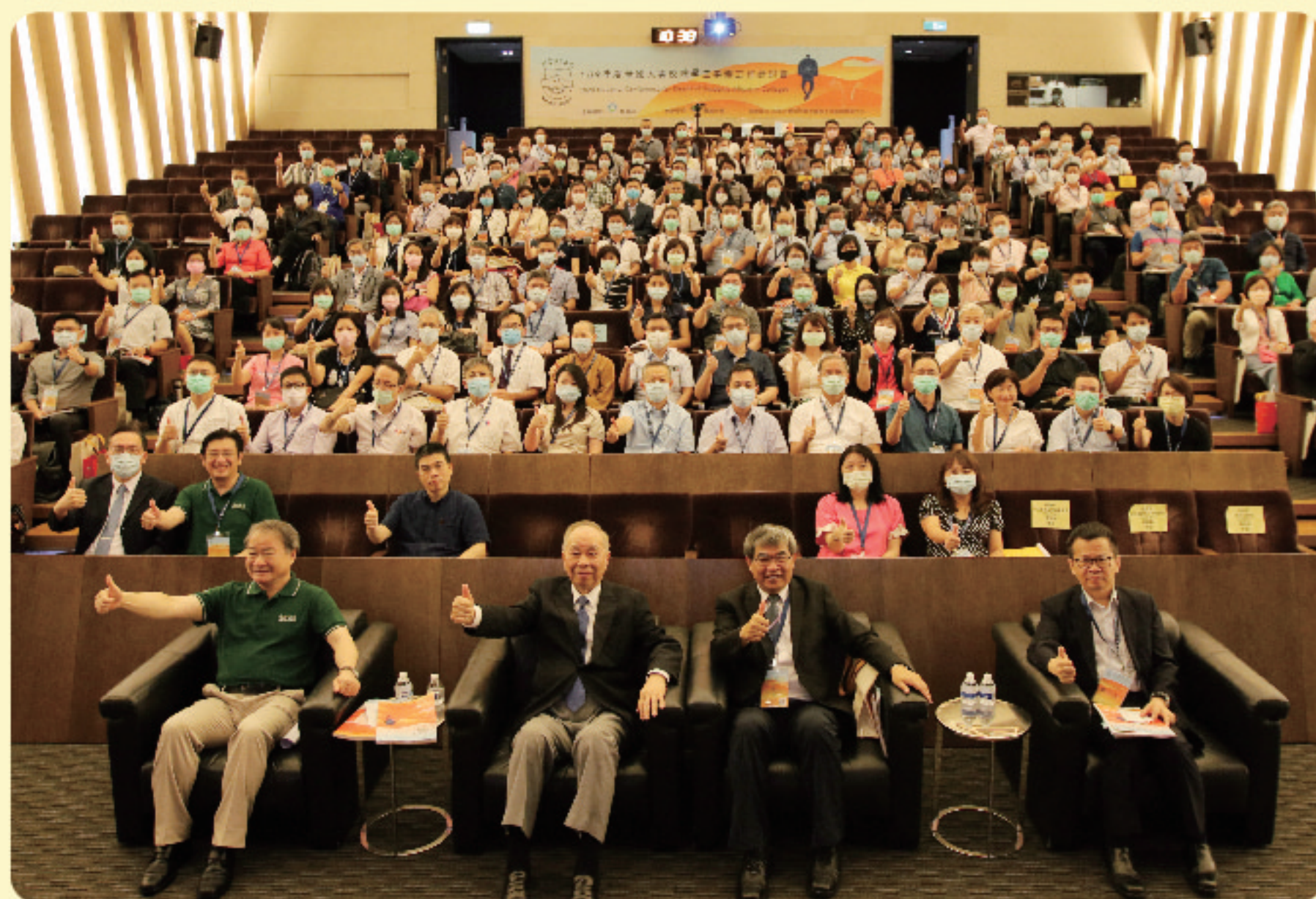
▲ 109年度全國大專校院學生事務工作研討會大合照

為使全國大專校院學生事務長深入瞭解當前學生事務重要措施及政策重點，促進經驗傳承與互動交流，教育部於8月20日在實踐大學舉辦「109年度全國大專校院學生事務工作研討會」。