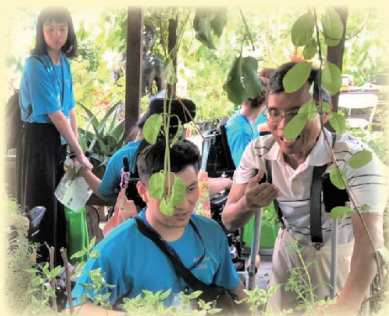
▲ 藝術夏令營的學生們參觀 臺中光復新村文創聚落

理全國性營隊活動為例，鼓勵特教學生走出戶外並透過育樂課程，增強對環境之適應與擴展視野；自去(108)年夏令營跨足藝術領域及跨障礙類別學生參加，除能發展特教學生藝術潛能，更能促使不同學校、不同障礙類別學生及服務的協助人員交流融合與互相瞭解。